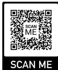
Figura 2. Código QR del procedimiento de ingreso.

A continuación, se adjunta del código QR en la figura 2, para visualizar el procedimiento de como poder instalar el programa en el celular para acceder al contenido de la propuesta de la realidad aumentada.