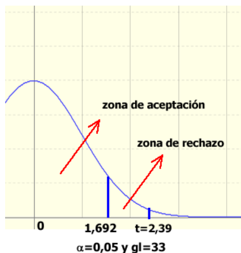
Figura 2. Zona de rechazo y aceptación de la hipótesis nula con 95% de confianza en el promedio de matemáticas

De acuerdo a la tabla de distribución T con \alpha=0,05 (95% de nivel de confianza) y 33 grados de libertad (gl en la tabla), el rango de aceptación de la H_0 está entre 0 y 1,697; por lo tanto, al haber obtenido un valor del estadístico t de 2,390 se rechaza la hipótesis nula y se acepta la hipótesis alternativa que se representa en el siguiente gráfico: