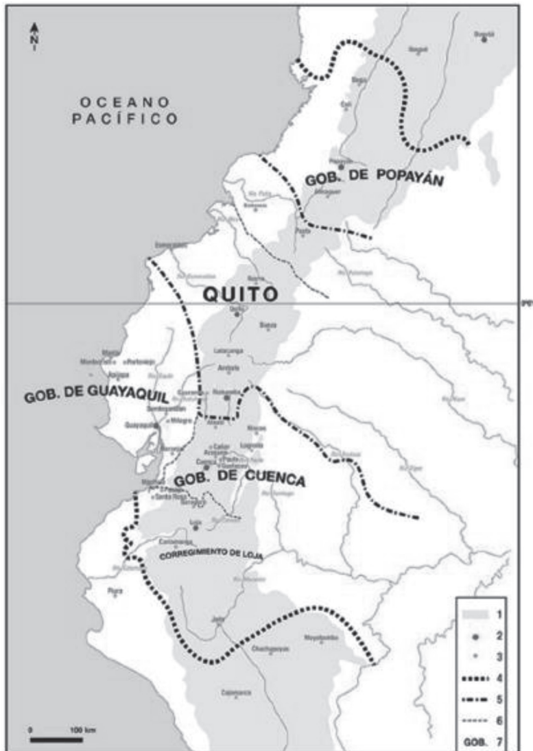
IMAGEN 1 GOBERNACIÓN DE CUENCA A FINES DEL SIGLO XVIII

Fuente: Jean Paul Deler, 2007. Adaptado y corregido por Ana Luz Borrero, 2016.