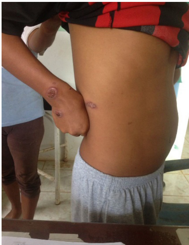
Lesión en línea axilar anterior derecha.