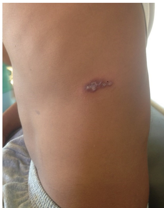
Imagen N° 6

A los 20 días de finalizar el tratamiento se observó la formación de una cicatriz lisa, deprimida, hipocrómica e inestética (Imagen N° 6).