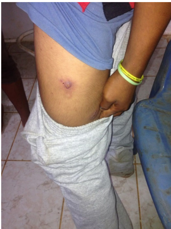
Lesión en muslo lateral

Se realizó control a los diez días de tratamiento observándose que el exudado desaparece, iniciando la regresión y reparación de la lesión a partir del centro hacia el exterior (Imagen N°5).