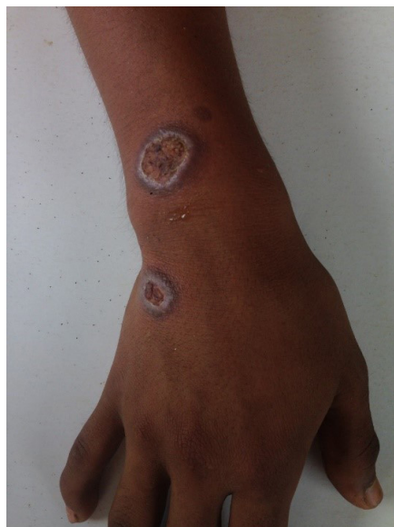
Exudado ausente, reparación de la lesión.

A los 20 días de finalizar el tratamiento se observó la formación de una cicatriz lisa, deprimida, hipocrómica e inestética (Imagen N° 6).