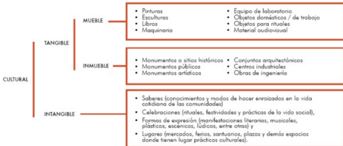
Figura 1: Categorías que conforman el patrimonio inmueble

En su más amplia concepción, el patrimonio es a la vez un producto y un proceso que proporciona a las sociedades una cantidad innumerable de recursos que se heredan del pasado, se crean en el presente y se transmiten a las generaciones futuras para su beneficio (UNESCO, 2009). La Organización de las Naciones Unidas para la Educación, la Ciencia y la Cultura (UNESCO) es una institución cuyo objetivo es el de crear y mantener diálogos entre diferentes culturas con el objetivo de establecer una mayor conciencia y consideración hacia los valores colectivos que pueden adquirir bienes materiales e inmateriales. En este contexto, en lo que refiere al patrimonio cultural, la UNESCO considera como su meta principal el de “promover la diversidad cultural, el diálogo intercultural y una cultura de paz”. Considerando el patrimonio cultural como un concepto que se clasifica en sus manifestaciones materiales e inmateriales, se puede decir que las dos grandes clasificaciones del patrimonio cultural son: Patrimonio Cultural Tangible e Intangible. A su vez, el patrimonio cultural tangible se clasifica en patrimonio mueble e inmueble (Figura 1). Este último es el objeto de estudio dentro de este apartado en el que se abarcan los monumentos o sitios históricos, monumentos públicos, artísticos, conjuntos arquitectónicos, centros industriales, obras de ingeniería, entre otros.