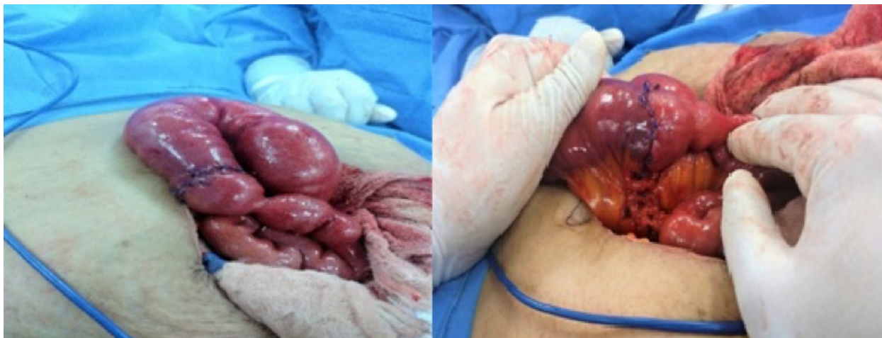
Imagen N° 5

Resección intestinal de aproximadamente 10 cm más anastomosis término terminal.