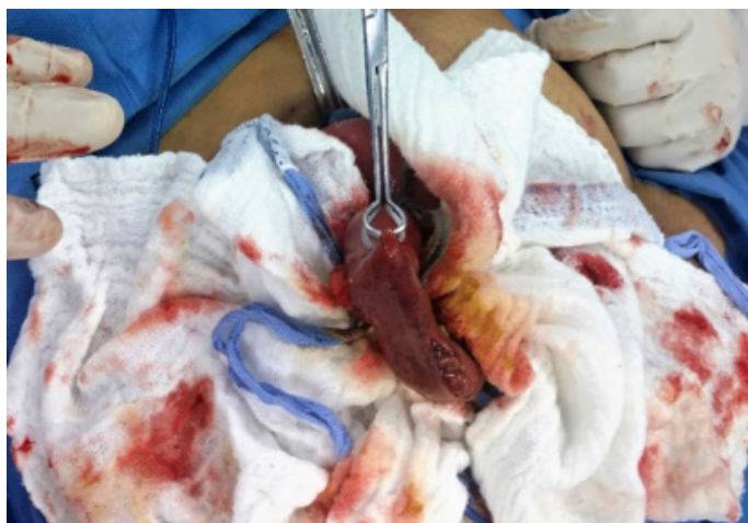
Imagen N° 4

Segmento intestinal violáceo, sin motilidad.