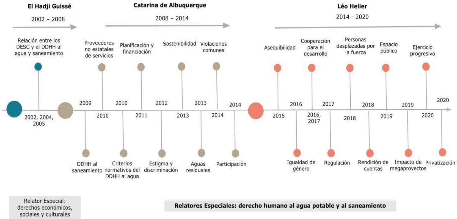
Figura 2. La evolución de la Relatoría Especial del derecho humano al agua.