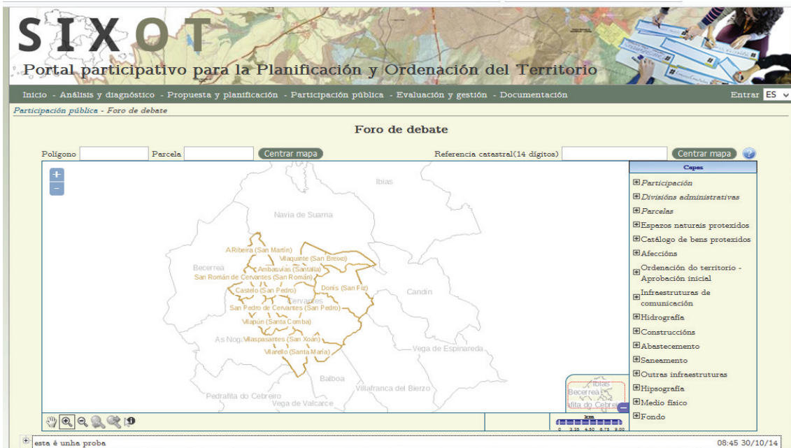
Figura 2. Foro Cartográfico SIXOT.

Según el análisis de Brown (2012), de varios PP GIS en el mundo, concluye que las falencias encontradas recaen en los métodos de recopilación de información pues estos requieren un mayor esfuerzo en el muestreo y que por ello las tradicionales técnicas, como el uso del papel para el mapeo de información es más eficaz, dando mayores tasas de respuesta, reduciendo el sesgo de participantes y una mayor participación en el mapeo.