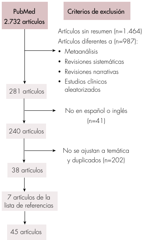
Figura 1. Proceso de selección de los artículos.

son el sobrepeso, el sedentarismo, la dislipidemia, la resistencia insulínica y la diabetes tipo 2, los cuales se han incrementado exponencialmente en la población. Sin embargo, dichos factores de riesgo son compartidos en general por las cardiopatías, de manera que muchos pacientes con cirrosis pueden tener enfermedades cardíacas concomitantes, sin que estas tengan relación directa con la injuria hepática, y son casos que corresponden a situaciones diferentes a la cardiomiopatía cirrótica [3].