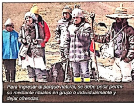
Para ingresar al parque natural, se debe pedir permiso mediante rituales en grupo o individualmente y dejar ofrendas.

Una vez que se arriba al lugar, los turistas son recibidos por los guardaparques, quienes habitan en un refugio construido por el Municipio de Cañar, ahí, se recibe alguna introducción sobre el