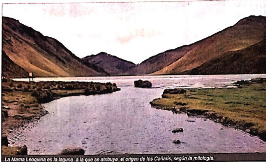
La Mama Leoquina es la laguna a la que se atribuye el origen de los Cañaris, según la mitología.