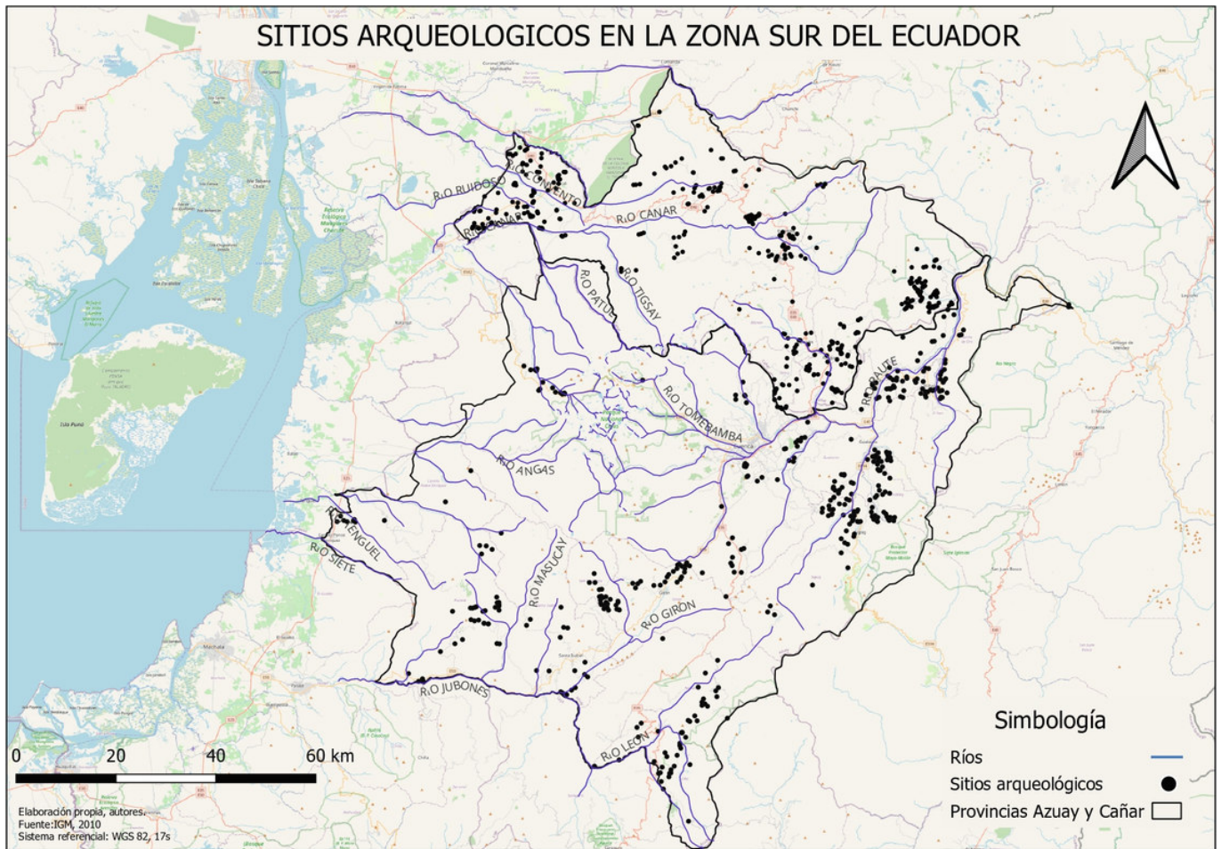
Figura 2. Mapa hídrico y de distribución de sitios arqueológicos.

cativo, representantes políticos y actores comunitarios vinculados al manejo del agua y el patrimonio arqueológico. Además, se realizó el análisis de la prensa escrita (diario El Mercurio ) para identificar las notas periodísticas, editoriales e información que generan los comunicadores en ese medio.