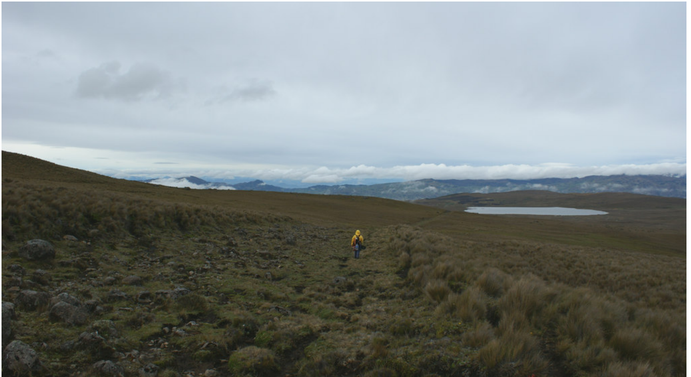
Figura 4. Paisaje arqueológico y agua: Qhapaq Ñan .

basadas en la observación no participante (Guber 2011). Estas conversaciones fueron abiertas, flexibles y dinámicas, no estructuradas, ni dirigidas, ni estandarizadas (Taylor y Bogdan 1987).