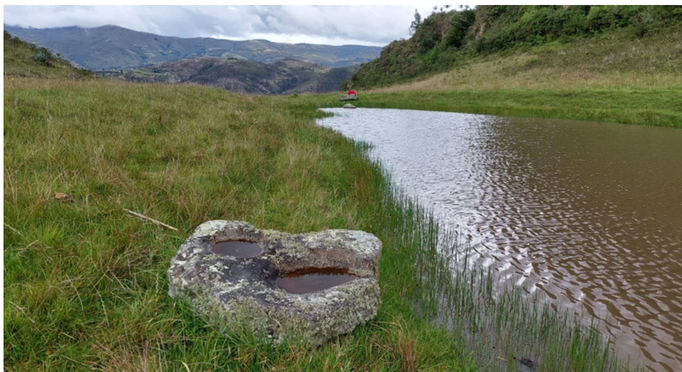
Figura 5. Laguna de Shuna y piedras trabajadas en el complejo arqueológico Dumapara.