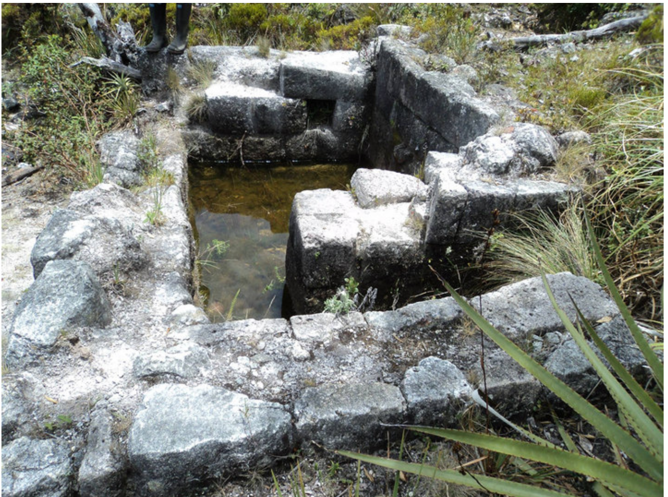
Figura 1. «Baño del Inca» del sitio arqueológico Mirador de Mollepongo (Pucará).

Facultad de Filosofía, Letras y Ciencias de la Educación, Universidad de Cuenca, Ecuador (✉ miguel.novillo@ucuenca.edu.ec )