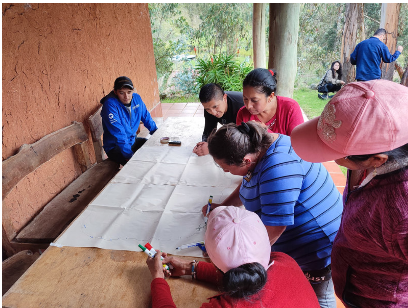
Figura 3. Elaboración de cartografía en el museo comunitario de Chobshi.

tura. Esta técnica también permitió indagar sobre los significados del pasado y el agua, además de reconocer la comprensión de los vínculos entre personas, situaciones y experiencias, con sus respectivas problemáticas socioculturales.