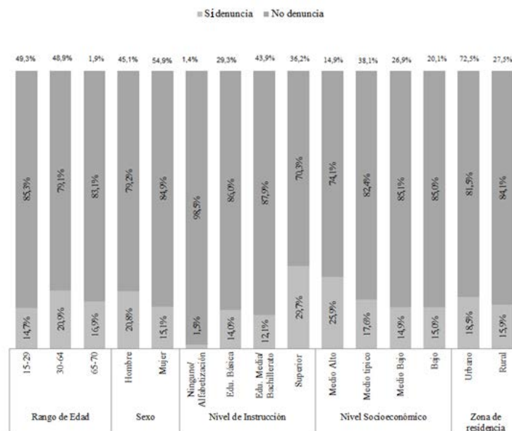
Gráfico 1. No denuncia según perfil sociodemográfico de la víctima. 2