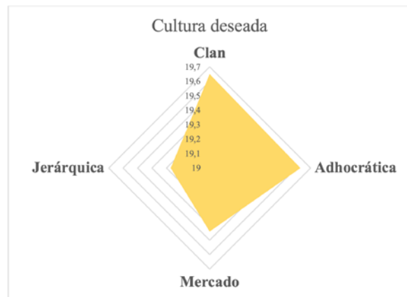
Figura 4. Cultura organizacional deseada de la Universidad de Cuenca

Por otro lado, la cultura organizacional deseada de la Universidad de Cuenca apunta a una estructura organizacional flexible y a un ambiente abierto al intercambio de experiencias y opiniones. Se espera que los líderes universitarios actúen como mentores, promoviendo el trabajo en equipo, la participación de toda la comunidad y el énfasis en valores como la lealtad y la tradición (véase la Figura 4).