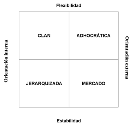
Figura 1. Modelo de valores en competencia

En definitiva, el modelo de Cameron y Quinn es una herramienta propicia para el análisis de las dos dimensiones generales de la cultura organizacional. Dichas dimensiones conforman cuatro cuadrantes o tipologías culturales que actúan como categorías de análisis del presente estudio: (1) clan, (2) adhocrática, (3) jerárquica y (4) mercado. Entonces, el estudio de la CO de la Universidad de Cuenca, a través del modelo de competencias de Cameron y Quinn, determina qué tipología está presente actualmente en esta organización educativa y, por consiguiente, qué dimensiones generales son las prevalentes.