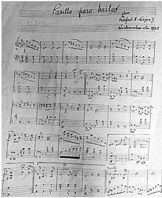
FOTO 17.- FRAGMENTO DE PASILLO PARA BAILAR, DE RAFAEL SOJOS, 1929.

Partituras encontradas en archivos familiares privados, en conventos e iglesias de la ciudad, en la biblioteca del Ministerio de Cultura, en el Conservatorio 'José María Rodríguez' e inclusive en la Biblioteca Municipal de Guayaquil, testimonian la existencia de gran cantidad de música manuscrita cuencana.