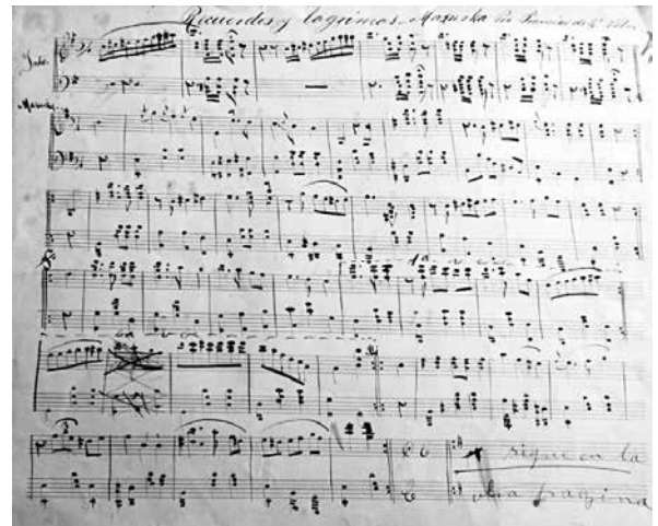
FOTO 10.- FRAGMENTO DE LA MAZURKA RECUERDOS Y LÁGRIMAS , DE FRANCISCO DE VÉLEZ

Francisco de Vélez es un compositor cuencano poco conocido, cuyas obras fueron recolectadas probablemente por Rafael Sojos o Luis Pauta, entre estas la mazurca Recuerdos y lágrimas (foto 10) (Archivo CJMR).