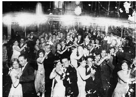
FOTO 16.- BAILE EN CUENCA CORRESPONDIENTE A LOS AÑOS VEINTE.