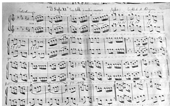
FOTO 7.- FRAGMENTO (PIANO I) DEL PASODOBLE SIGLO XX PARA PIANO A CUATRO MANOS DE ALBERTO RODRÍGUEZ.

pasodobles durante todo el siglo XX, en menor medida en las dos últimas décadas.