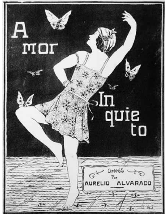
FOTO 15.- PORTADA DE AMOR INQUIETO , ONE STEP OP. 65 DE AURELIO ALVARADO

El Pasillo para bailar (foto 17), de Rafael Sojos, a más de poder ser escuchado en piano, invita al baile. Una vez más se inscribe en una partitura la contextualidad de una obra musical.