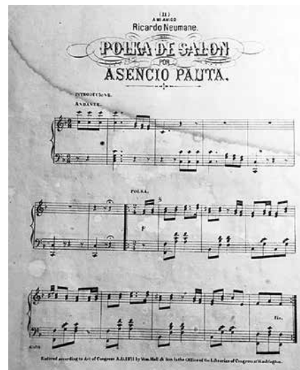
FOTO 5.- FRAGMENTO DE UNA POLKA DE ASCENCIO DE PAUTA.

La polka de salón (foto 5), de Ascencio de Pauta, lleva el calificativo de salón corroborando la existencia de este estilo, está dedicada a su amigo Ricardo Neumane y está publicada en Estados Unidos.