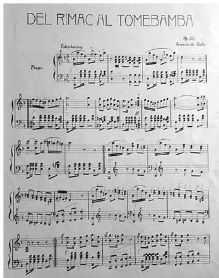
FOTO 6.- FRAGMENTO DEL BOLERO ESPAÑOL DEL RIMAC AL TOMBAMBAMBA OP. 53 DE ASCENSIO DE PAUTA.