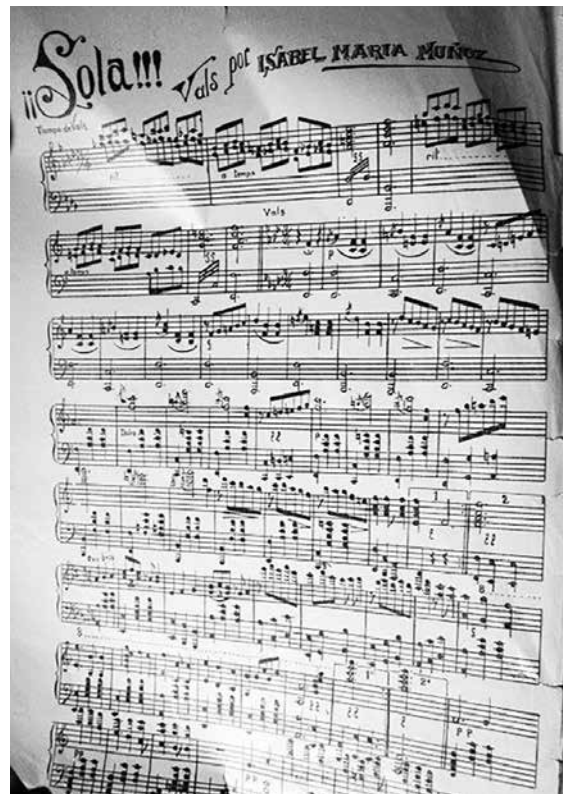
FOTO 18.- PORTADA Y FRAGMENTO DE SOLA, VALS DE ISABEL MARÍA MUÑOZ.