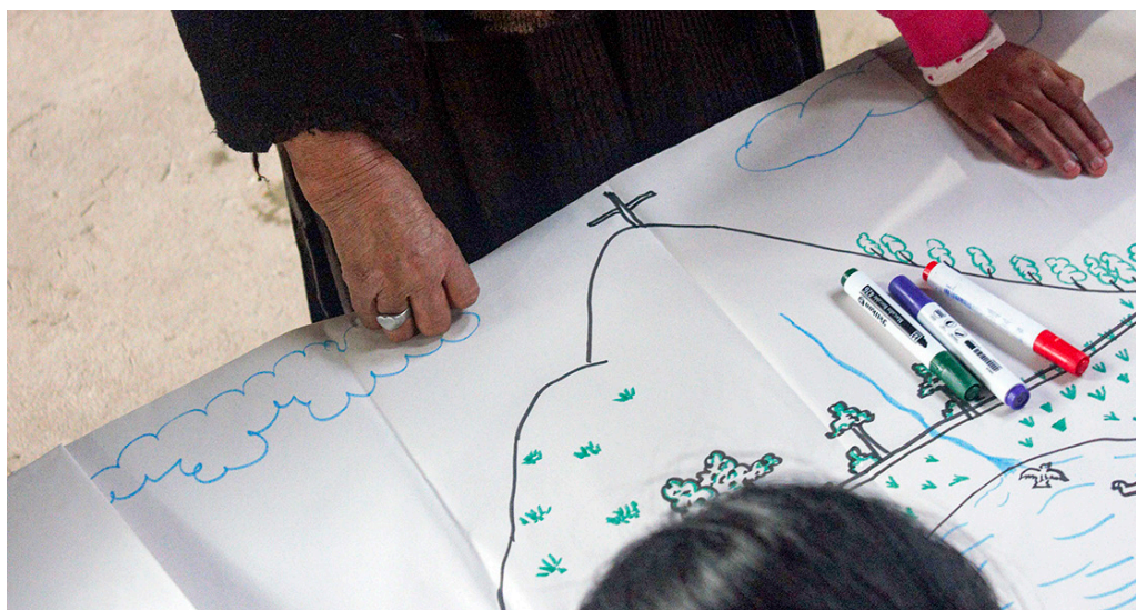
FIGURA 8. REPRESENTACIÓN SOCIAL Y CULTURAL DEL CERRO ACACANA.