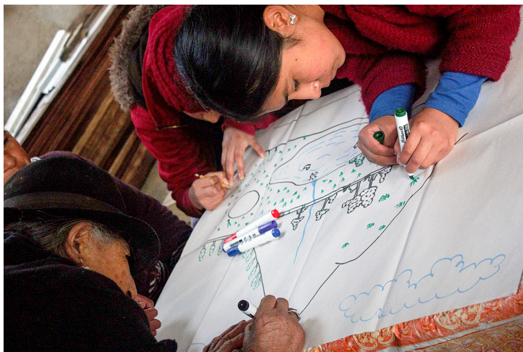
FIGURA 3. REPRESENTACIONES CULTURALES SOBRE EL PATRIMONIO.

La percepción muestra la forma en la que es concebida la realidad y permite aproximarse a una comprensión más adecuada de las impresiones que tiene una cultura o sociedad, así como los significados que a este le atribuyen (figura 3).