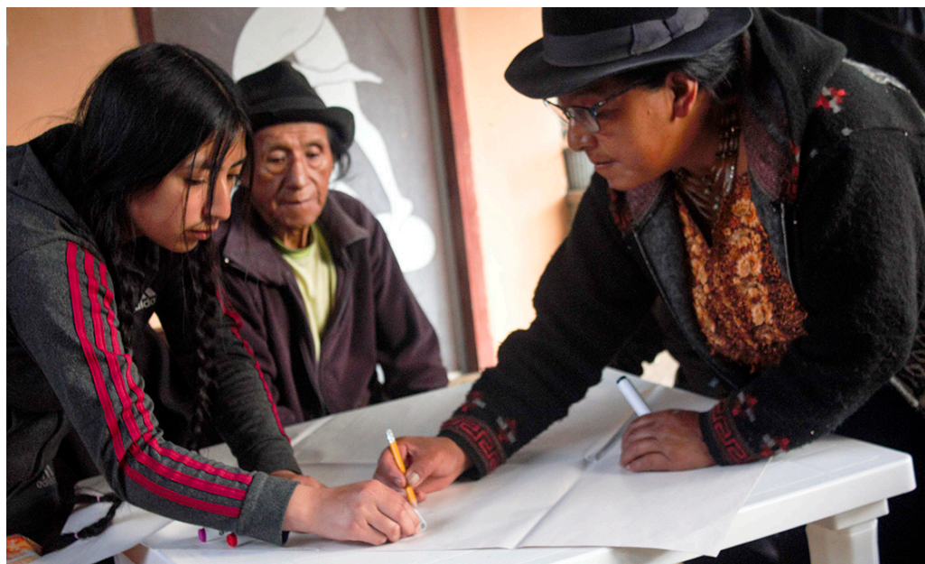
FIGURA 2. POBLADORES DE CIUDADELA REALIZANDO CARTOGRAFÍA.

La propuesta metodológica que direcciona este estudio se planteó desde un enfoque cualitativo (figura 2). La combinación de la observación directa, la cartografía social y la entrevista (Whyte, 1982; Guber, 1991), permitieron incorporar las percepciones e imaginarios de la población, pues no solo se debe atender a los ejes espaciales, sino también al eje del sentido, como un elemento fundamental frente a su patrimonio arqueológico 1 .