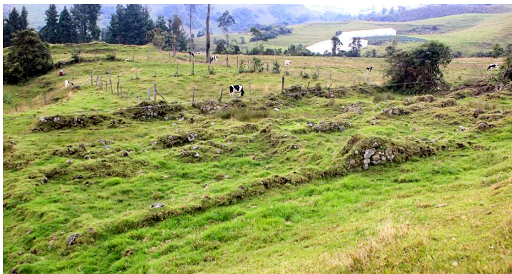
FIGURA 7. ESTADO ACTUAL DE SITIO ARQUEOLÓGICO TAMBO BLANCO.