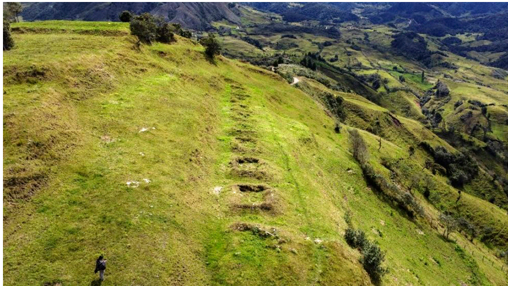
FIGURA 5. TERRAZA Y KOLKAS DE TAMBO BLANCO.

conocidas como piedras tacitas (figura 6), una de ellas presenta siete oquedades circulares de diferentes dimensiones. La segunda, modificada en la superficie, presenta 3 agujeros circulares. Este tipo de piedras, generalmente tiene dos asociaciones, una con un observatorio de astros y otra con una piedra de moler granos.