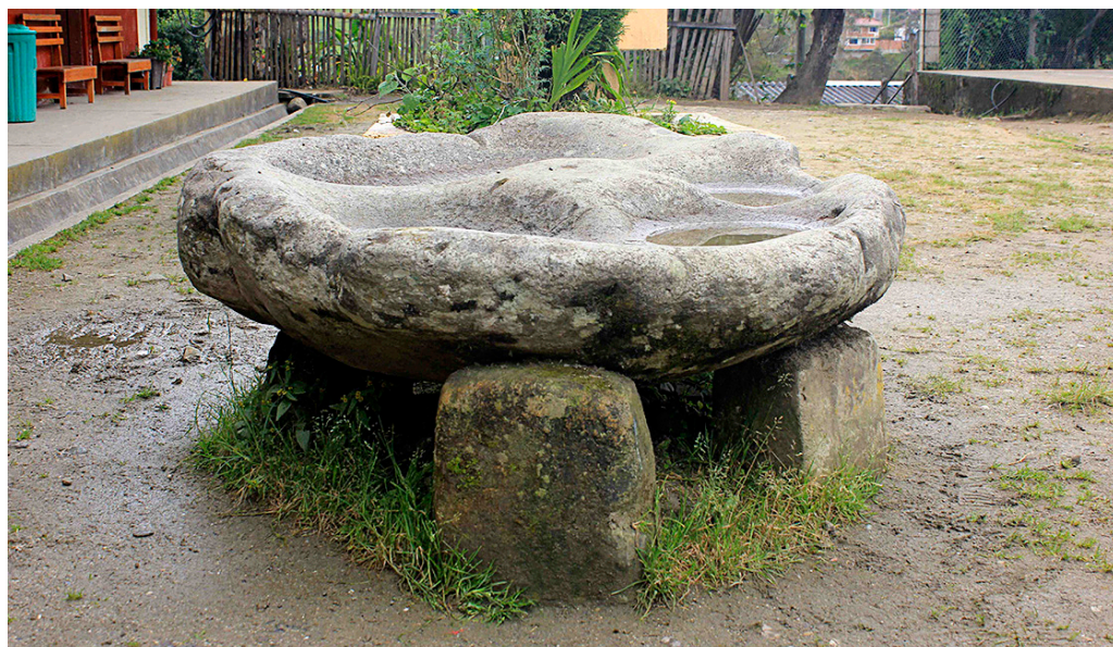
FIGURA 9. PIEDRA EXTRAÍDA DEL SITIO ARQUEOLÓGICO TAMBO BLANCO.