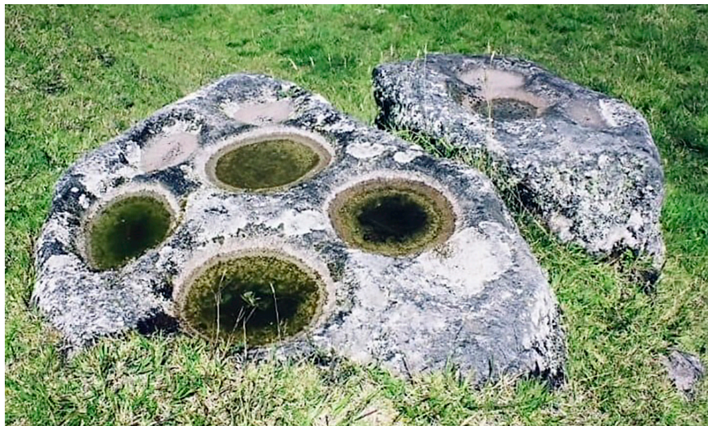
FIGURA 6. PIEDRAS TÁCITAS EN TAMBO BLANCO.