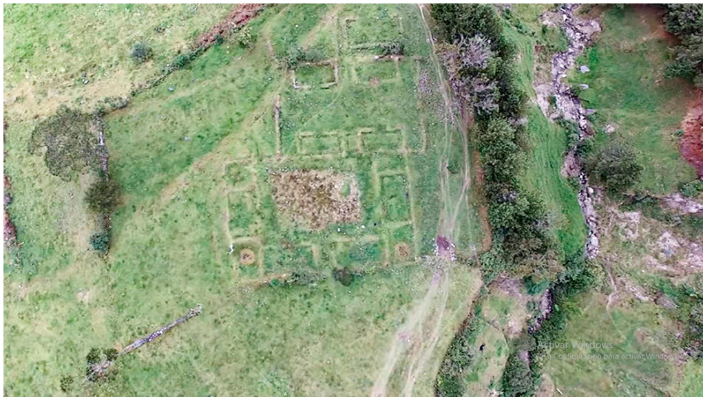
FIGURA 4. VISTA PANORÁMICA DE TAMBO BLANCO.

El acercamiento bibliográfico y la observación del sitio arqueológico Tambo Blanco permitió identificar varias estructuras dispuestas en superficie. Estas estructuras -pese a que no existen estudios arqueológicos a profundidad sobre el sitio- han sido designadas como kallankas , kollkas , palacio, entre otros (figura 4).