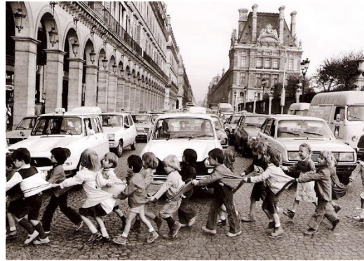
Figura 4: Doisneau, R. (1978).

puede convertirse en agente, vehículo o apoyo social de esta realización” (1978:139).