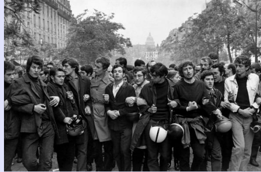
Figura 5: Manifestación estudiantil, París.

También es cierto que en la actualidad este frente es imposible. Esta utopía, aquí como en muchas otras ocasiones, proyecta sobre el horizonte un 'posible-imposible'. Por suerte o desgracia, el tiempo, el de la historia y la práctica social, difiere del tiempo de la filosofía. Aún si no produce lo irreversible, puede producir lo que será difícilmente reparable. Como escribiera Marx, la humanidad sólo se plantea los problemas que puede resolver. Algunos creen hoy que los hombres sólo se plantean problemas insolubles. Desmienten a la razón. Sin embargo, quizás haya problemas de fácil solución con la solución a mano, muy cerca, y que las gentes no se plantean.