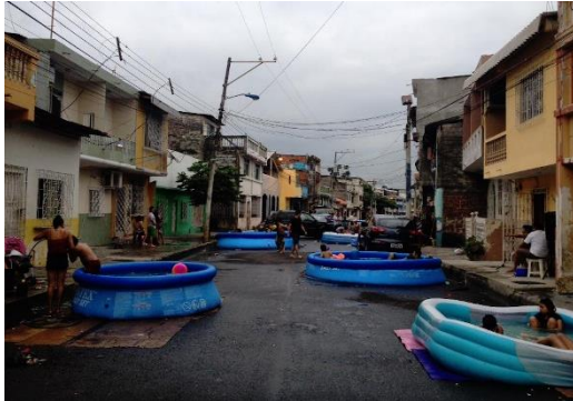
Figura 3: Carnaval en La Décima entre Robles Chambers y El Oro, Ciudadela La Chala, Guayaquil. Fuente: Ruiz, P. (2016).

Segundo tablero, grandeza de lo cotidiano: