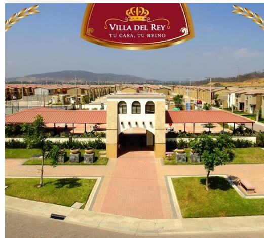
Figura 1: Villa Del Rey, conjuntos residenciales económicos, Guayaquil, 2015.

Fruto del conjunto de las reflexiones en el campo de la teoría crítica urbana planteadas fundamentalmente por Brenner, es posible sostener que en medio de las hipótesis sobre los procesos de transformación y urbanización planetaria – analizadas por autores como Davis, 1955 o Lefebvre, 1970– arrastramos modelos urbanísticos del capitalismo avanzado que reproducen sistemas urbanos estandarizados y homogeneizantes, tendentes a una sofisticación neoliberal en un momento, en que las ciudades, sobre todo de países con economías emergentes, experimentan procesos acelerados de reestructuración con incertidumbre social. Este fenómeno está ocurriendo por default , al margen de las ideologías de los gobernantes de turno y sin que las instituciones, ni la sociedad puedan revertir las relaciones de poder en la supremacía de fuerzas de la urbanización del capital sobre la vida del ser humano.