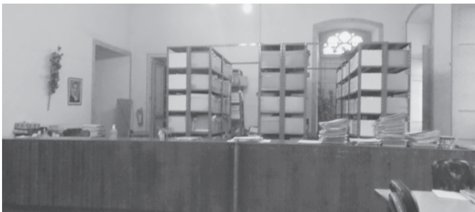
Figura 1.2 Archivo Histórico de la Curia de Cuenca. Foto tomada por Arleti Molerio noviembre de 2013.