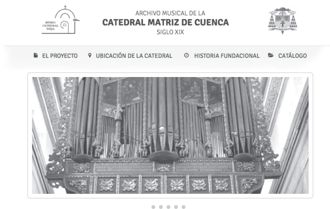
Figura 1.3 Ingreso a la base de datos del Catálogo musical de la Catedral Matriz, página de inicio.

A continuación presentamos las diferentes pantallas del sitio, comenzando con la página de inicio. El programa permite la búsqueda por campos y la implementación de la documentación en pdf consiente el recurso de ampliación de la imagen según las necesidades.