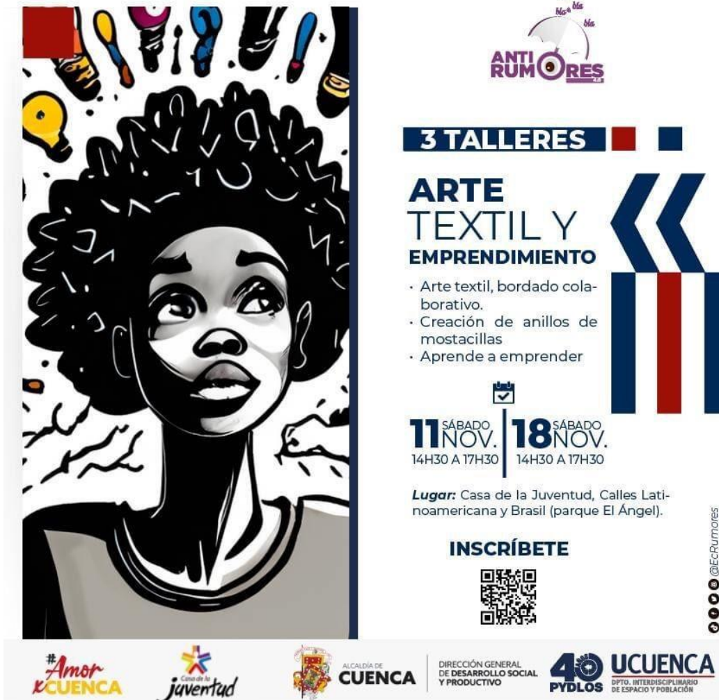
Anexo A. Publicidad de taller de Arte Textil y Emprendimiento