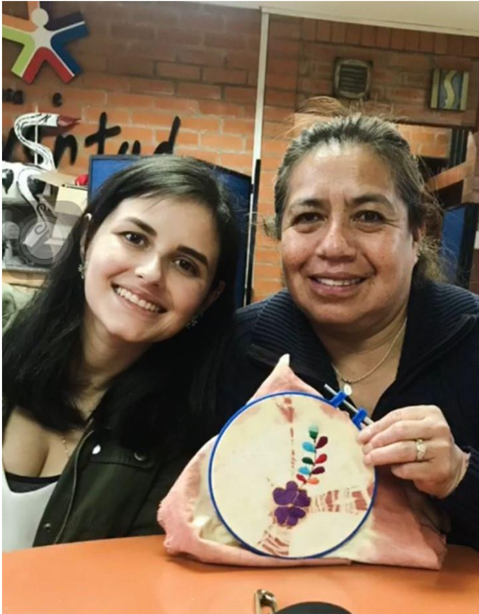
Anexo B. Fotografías de la primera clase piloto de bordado.