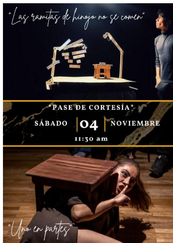
Fuente: Fotografía promocional de la obra "Uno en partes" presentada en la Ciudadela La Cascada de la parroquia Baños, el 4 de noviembre de 2023.