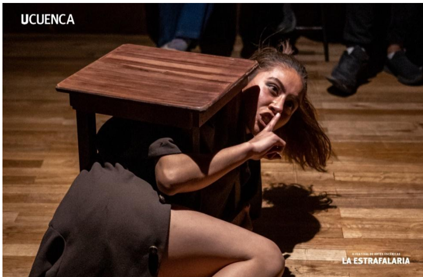
Fuente: Fotografía promocional de la obra "Uno en partes" presentada en el Festival de Artes Escénicas "La Estrafalaria", en el 23 de julio de 2023.