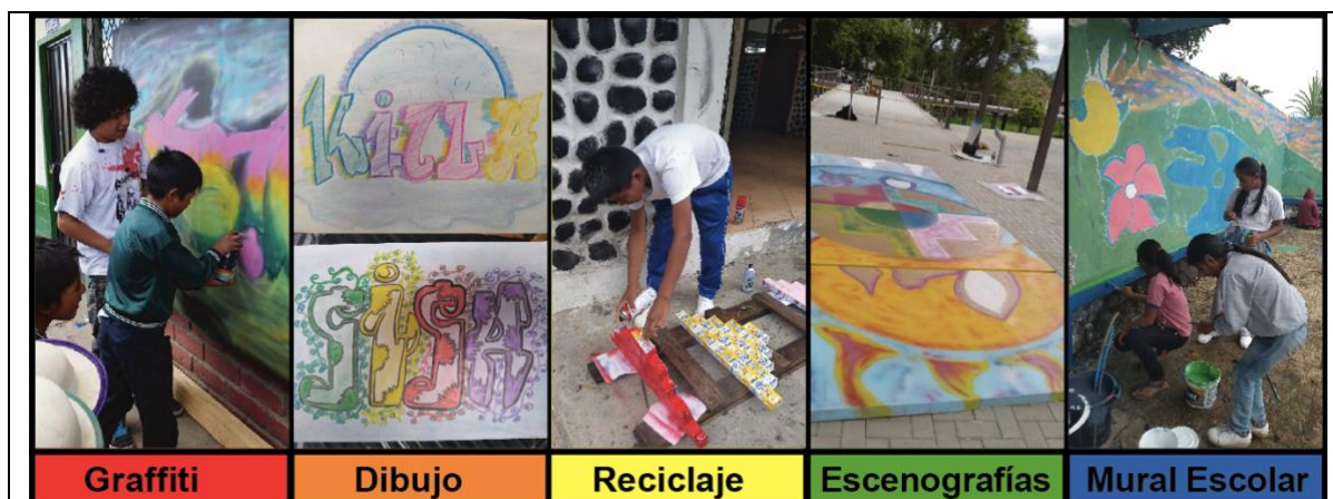
Figura 2. Trabajos de arte urbano realizados con estudiantes.

Para ello, se ha trabajado el arte urbano desde graffitis en una hoja, maquetas con material reciclado, hasta proyectos escolares de pintura mural en los exteriores de las instituciones educativas (ver gráfico 2).