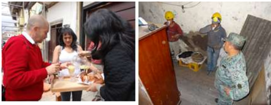
Figuras 9 y 10. Proyecto vliirCPM , Momentos en los que los propietarios compartían un refrigerio. (2014)

En toda minga existen contrapartes. En el caso de San Roque el barrio asumió en forma organizada y responsable el pago de la mano de obra especializada de los maestros-albañiles, el costo que correspondía al tiempo que el albañil trabajó en su predio, calculándose este rubro por horas/día de trabajo. Igualmente fue responsabilidad del propietario el ofrecer refrigerios para el personal que laboraba en el predio, aspecto importante por la fuerza y dificultad de las jornadas de trabajo. Es interesante señalar que por propia iniciativa, el barrio se organizó bajo la estructura de la minga para elaborar los refrigerios. (Figuras 9 y 10)