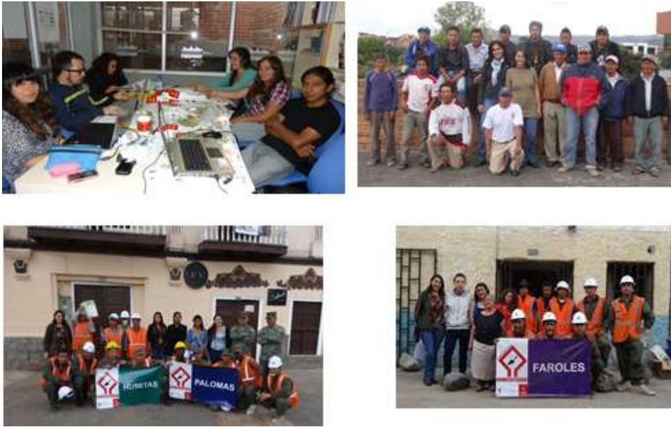
Figura 5, 6, 7 y 8. Proyecto vlrCPM , Imágenes de reunión de coordinación y equipos de trabajo. (2014) Fotografía.