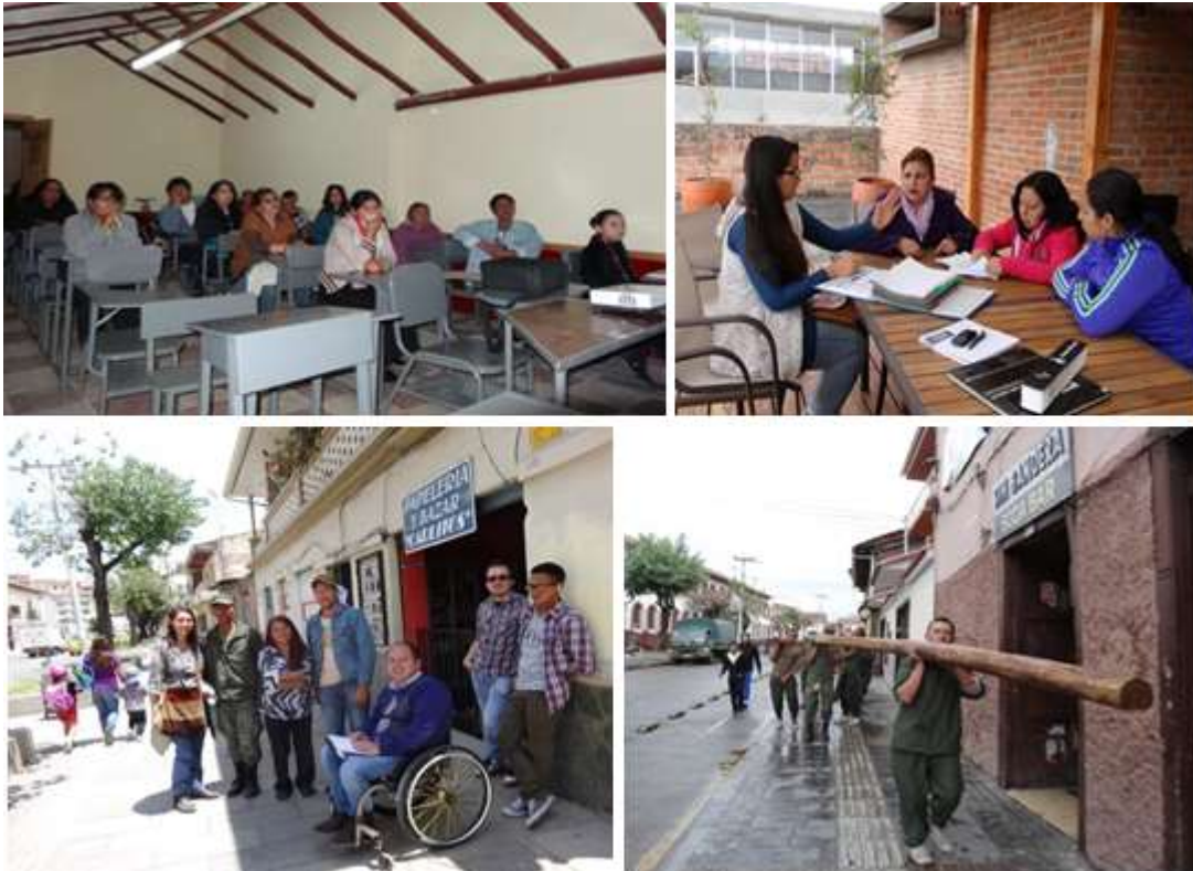
Figuras 11, 12, 13 y 14. Proyecto vIirCPM, Reuniones de sociabilización con la comunidad y equipo de trabajo en “minga”. (2014)

La minga como herramienta para conservar el patrimonio se fundamenta entonces en cuatro premisas: