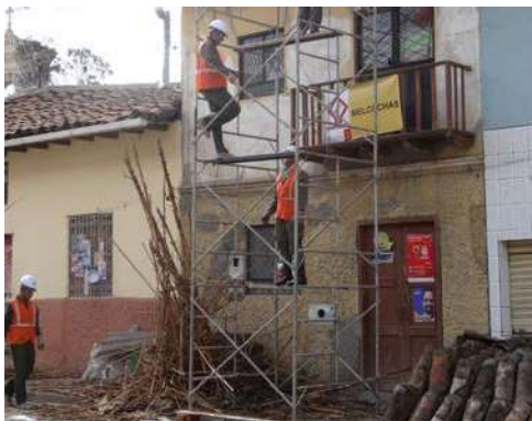
Figura 2: Campaña San Roque