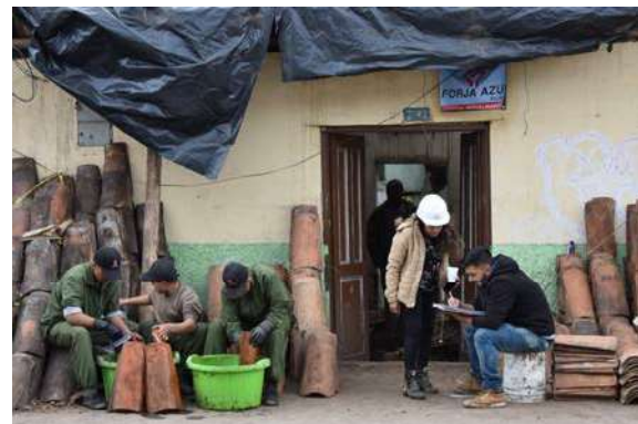
Figura 3: Campaña El Vergel