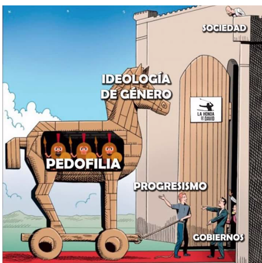
Ilustración 3. Nota de campo, 30 de junio de 2020

La libertad pasajera es definida como aquella que tiene que ver con la vida cotidiana. Es en donde el grupo siente que la ideología de género se busca imponer, a través de las escuelas, la familia, los trabajos, la vida pública, etc. Ellos asumen la defensa de la vida “natural” como la plataforma de lucha contra todo lo que busque normalizar costumbres ajenas.