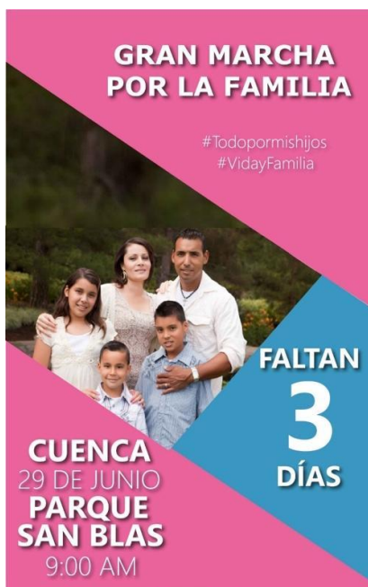
Ilustración 7. Notas de campo, 10 de julio de 2019

Cuenca lucha por la vida, por su parte también manejó mensajes similares a los de CL, pero, a diferencia de Por la Familia, la forma y contenido de estos buscaban generar desprestigio a la lucha por el matrimonio igualitario y miedo hacia sus activistas. Con una estrategia de comunicación influenciada por Cristianos Libertarios denunciaron la intervención de agendas progresistas internacionales en el Ecuador y también denunciaron a los integrantes de la misma corte por considerarlos simpatizantes y activistas del matrimonio igualitario. Esta página buscaba desprestigiar el propio proceso de trámite en la Corte Constitucional ante la opinión pública (Notas de campo, 30 de marzo de 2019).