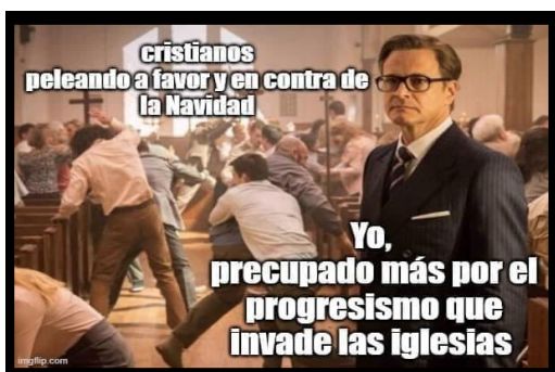
Ilustración 1. Notas de campo, 28 de diciembre de 2020

Desde el grupo se reconoce a la libertad eterna como la defensa de la fe cristiana. Esta defensa de la fe cristiana aparece como un enmarcado performativo en diferentes campañas de redes sociales que buscan construir un imaginario en donde el otro aparece para destruir a la Iglesia a partir de la normalización de costumbres progresistas dentro de sus instituciones religiosas.