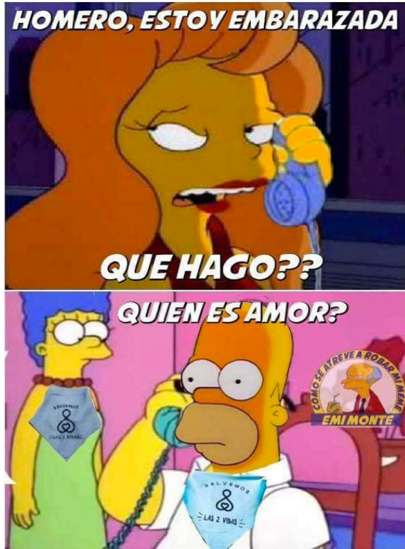
Ilustración 4. Notas de campo, 2 de febrero de 2019

Ante el meme de la ilustración 4, esta fue la propuesta de respuesta: