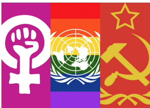
Ilustración 2. Notas de campo, 15 de febrero de 2020

Esta publicación refleja el interés que tiene el grupo de superar las diferencias religiosas a partir de la consolidación de los mismos enemigos, en este caso el avance progresista o de las agendas de derechos de la “ideología de género”