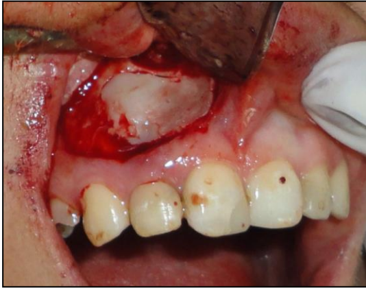
Fig. 3. Escisión quirúrgica de la lesión.