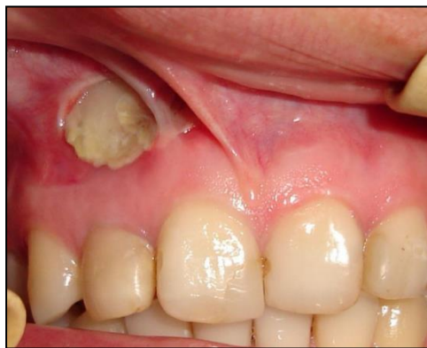
Fig. 1. Imagen clínica de la lesión.

vestibular la paciente evidencia una lesión indurada, expuesta a la cavidad oral, por encima de canino y lateral, con encía enrojecida y dolorosa alrededor. Tras exploración clínica intraoral se observa una lesión blanquecina con secreción de tipo purulenta a su alrededor, firme, contextura rígida similar al hueso y diámetro aproximado de 1,5 cm. (Figura 1). Debido a las características de la lesión, se refiere el caso al especialista maxilofacial.