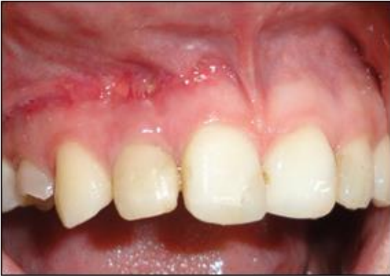
Fig. 6 y 7. Controles clínicos postquirúrgicos.