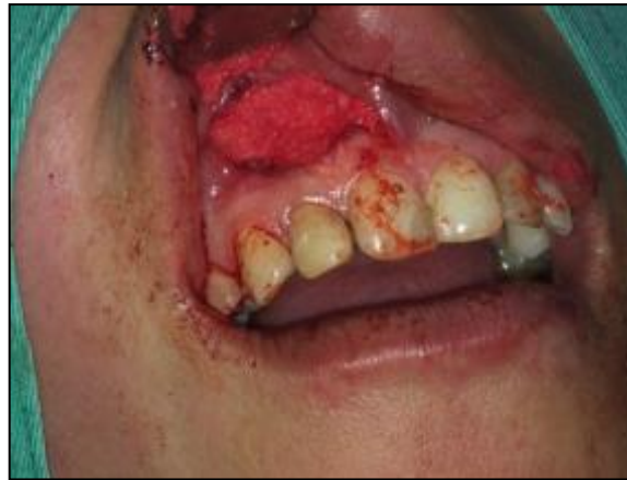
Fig. 5. Relleno del defecto óseo con sticky bone.