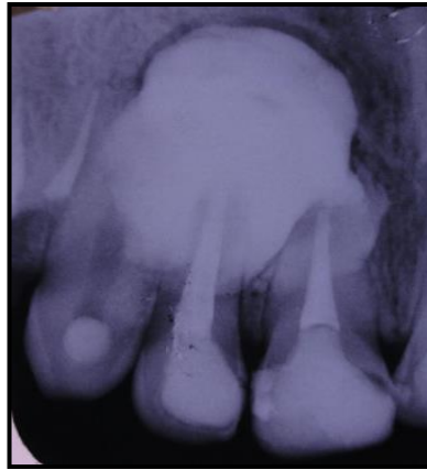
Fig. 2. Radiografía periapical de la lesión.