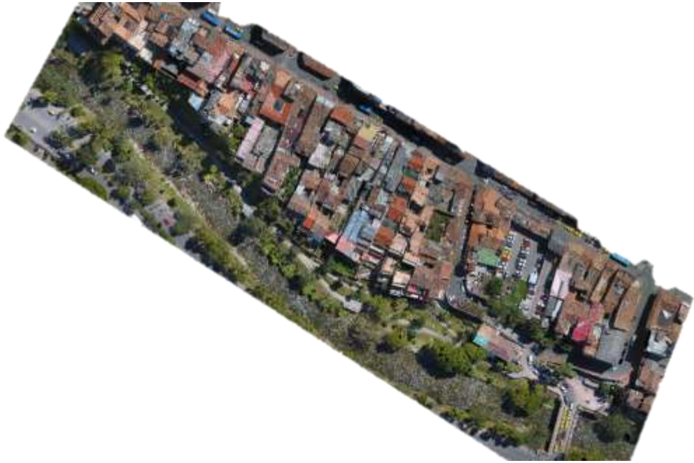
Figura 1. Imagen aérea del sector El Barranco. (2017)

La clasificación se realizó utilizando el algoritmo de Maquinas de Vectores de Soporte (Supported Vector Machines – SVM) y la utilización de diferentes funciones kernel 2 . Posteriormente, se evaluó la calidad de la clasificación, utilizando una matriz de confusión con la que se calculó el desempeño del algoritmo. frente a las muestras utilizadas para entrenar el modelo de predicción, permitiendo realizar los cálculos del índice kappa que establece el grado de acuerdo que existe entre dos observaciones independientes.