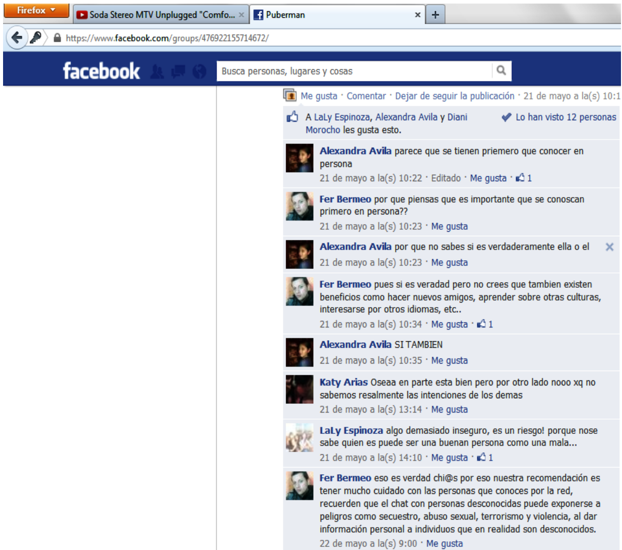
Ilustración 4 Interacción y Participación con el tema relaciones virtuales

En el segundo tema planteado, se aprecia un interés manifiesto por los jóvenes, ya que es un tema que es desconocido para ellos.