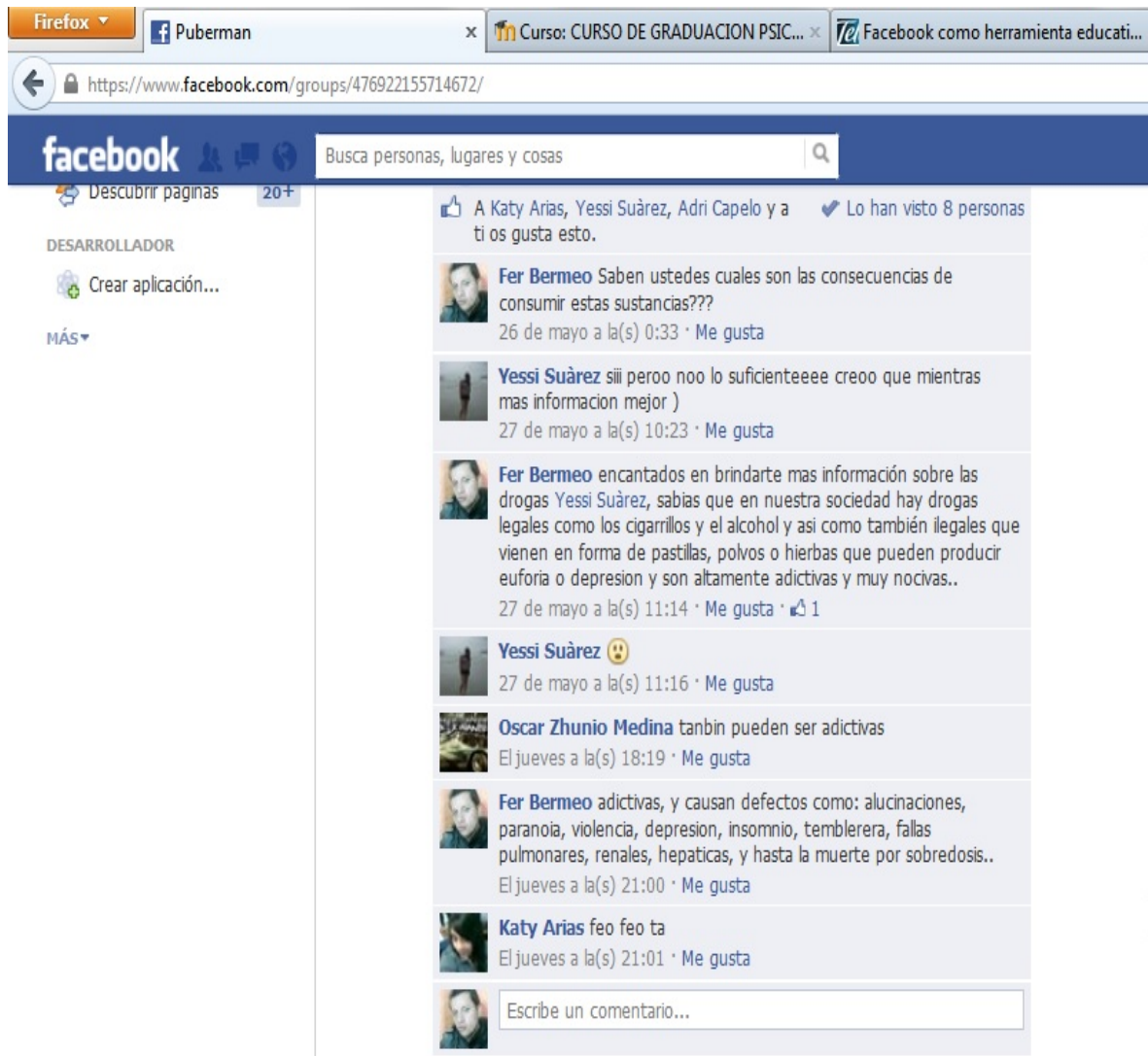
Ilustración 5 Interacción y Participación con el tema las drogas

Y en este tercer tema trazado pudimos verificar el interés y la participación abierta de los integrantes de nuestro grupo.