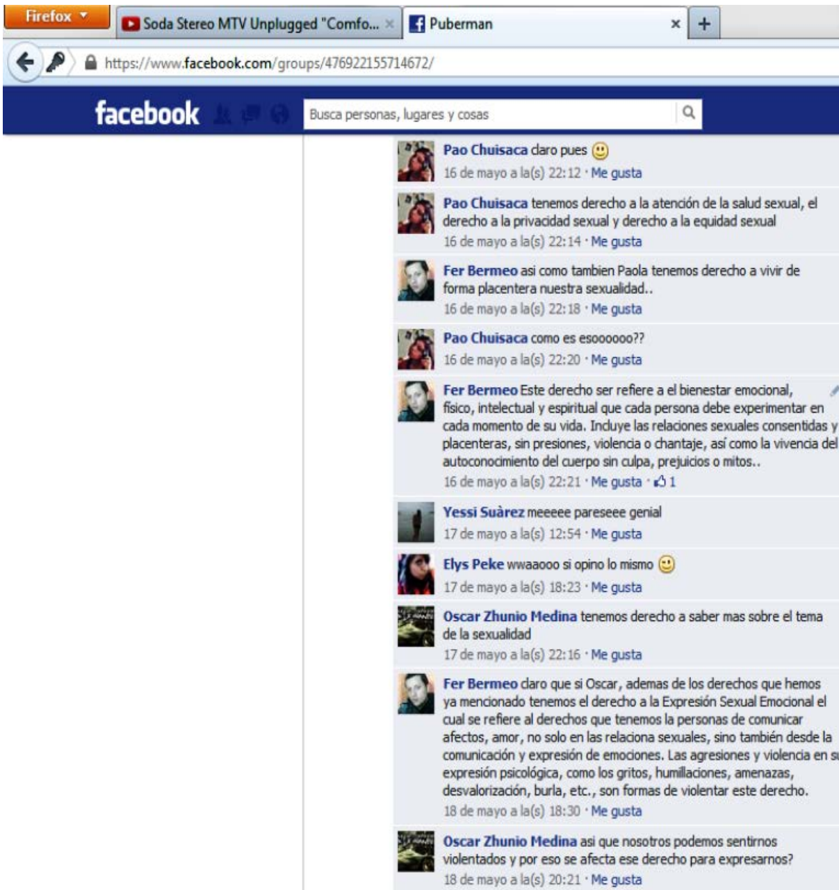
Ilustración 3 Interacción y Participación con el tema de la Sexualidad

Como se puede apreciar, los adolescentes empiezan a interactuar y a participar contribuyendo con conocimientos y preguntas sobre el tema programado.