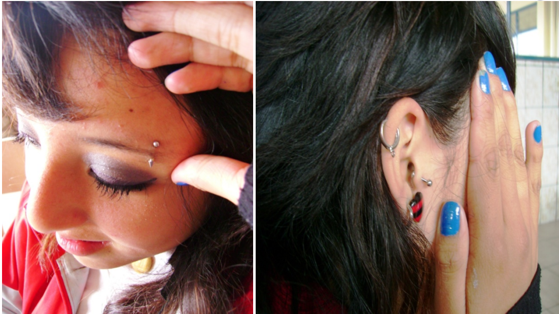
Nuestra informante muestra sus rasgos de identidad.

Hice un día, en la hora del recreo, que se quedara en el curso. Le pedí mantener una conversación tranquila y a solas. En ese momento pude escuchar a una chica muy sensible, abierta completamente al diálogo conmigo. Tuvimos la oportunidad de desahogarnos de forma mutua, por un lado solicitándole explicaciones de su comportamiento en el colegio y sus bajas calificaciones, y, por otro, ella necesitando apoyo a causa de los problemas en su hogar y en su vida en general. Desde ese momento pude establecer un lazo directo con ella y conocer en parte sus conflictos y dificultades, sus necesidades y su pensamiento.