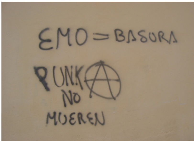
En la pared frente al colegio se encuentra este mensaje.

Fue importante en esta investigación estar presente con ellos en su territorio, en su espacio público. Todos los chicos de esta cultura juvenil viven en el mismo barrio, por ende éste constituye su espacio público de reunión y concentración. En el barrio “Los Sauces”, sector populoso de Cuenca, alrededor de la cancha de uso múltiple existe un pequeño escondite, un espacio verde donde durante las tardes y noches se reúnen, oyen música, hacen fogatas, y los fines de semana beben licor. El sitio de concentración de los punkeros dentro de la ciudad es el parque central de la ciudad, el Parque Calderón, y la subida del Puente del Vado, cerca del Centro Cultural “El Prohibido”.