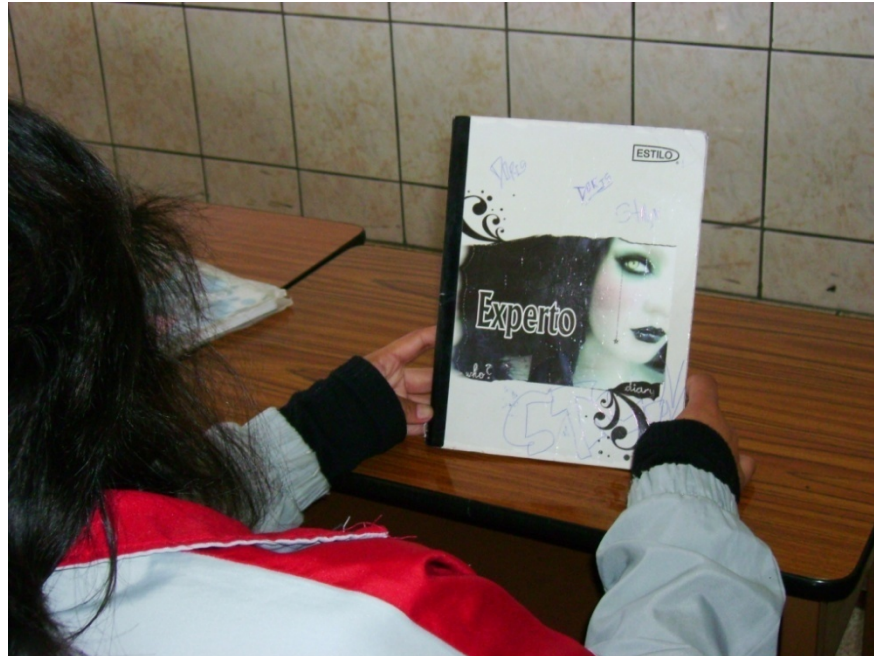
Las culturas juveniles inician su identidad dentro de las aulas del colegio