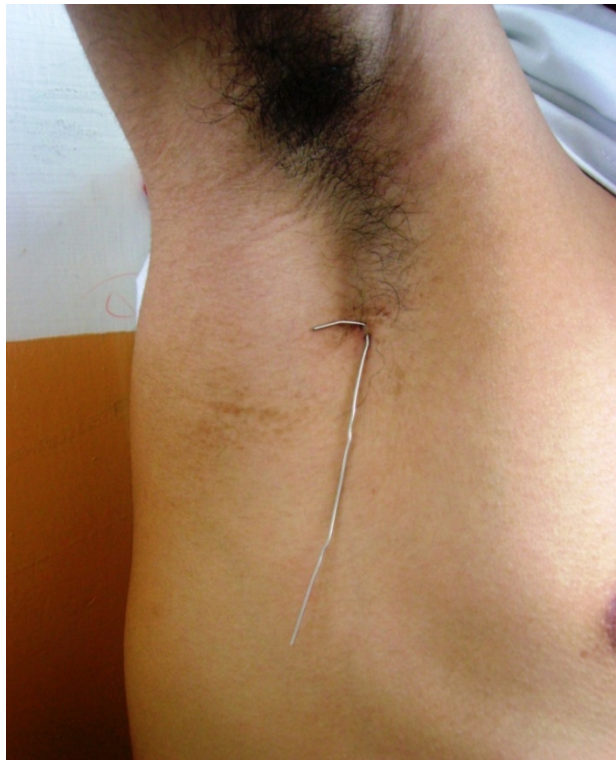
Ciertos jóvenes como Sebas utilizan “extensiones” que forman parte de su cuerpo

Al consultarle a Sebas qué significa en su vida estar en el grupo, manifiesta que es algo demasiado importante. En la calle se siente importante y anda tranquilo, se lleva con todos, eso le ha dado importancia y consiguió ser líder en la actualidad: