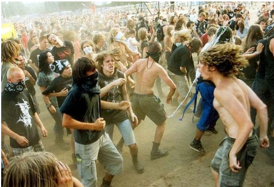
El baile del “mosh” característico en los conciertos de rock.

confianza. En estos conciertos la forma de comportarse va en escala: de una manera tranquila antes que inicie; cuando suena la música todo el ambiente se torna violento, y conforme pasa el tiempo el consumo de licor y drogas sube la adrenalina, el movimiento y el hondear de la cabeza caracterizan el baile, sacan sus cadenas y ejecutan el mosh , en el cual se golpean unos con otros, saltan, gritan y “se rompen entre ellos.”