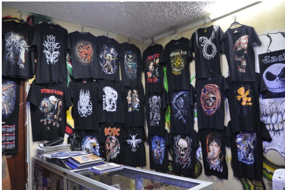
Los atuendos de los metálicos se los consiguen fácilmente en los almacenes de la ciudad.

Dentro de esta cultura existen dos tipos de grupos: el uno son los metaleros, que abarcan géneros musicales como el heavy metal , el death metal , el trash ; y el otro grupo son los Blackqueros o Satánicos, que tienen gusto por la música anticristiana, música satánica.