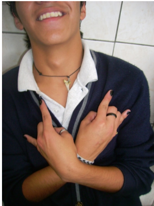
Informante con su uniforme escolar, y sus uñas pintadas.

del resto de sus compañeros. Sus collares eran pronunciados, su rostro estaba completamente pintado, Para ingresar al colegio tenía que lavarse el rostro, pero a pesar de esto quedaban huellas, sus cejas eran delineadas de negro. En sus manos llevaba manillas y anillos, y las uñas las tenía todas pintadas de negro. Esto sin duda llamaba la atención de las autoridades encargadas de controlar algo que estaba prohibido dentro del establecimiento, y nacía allí una disputa personal. Pablo quería presentarse como es, sin discriminación, y la posición de los directivos era lo contrario.