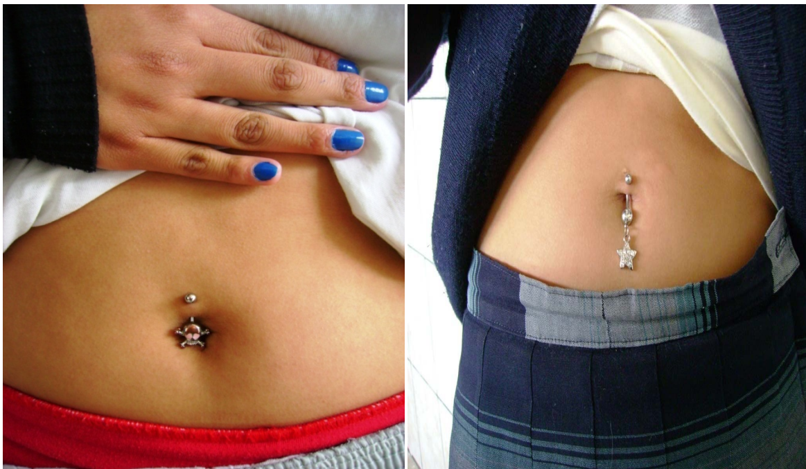
La utilización de piercings es frecuente en jóvenes del colegio

Con estos antecedentes teóricos planteamos en este capítulo profundizar el estudio de las culturas juveniles en Cuenca, que se forman desde el colegio, en el cual realizamos este estudio etnográfico, cómo se identifican, cuáles son los entornos en que se rodean y, finalmente, el espacio público que ocupan dentro de la ciudad.