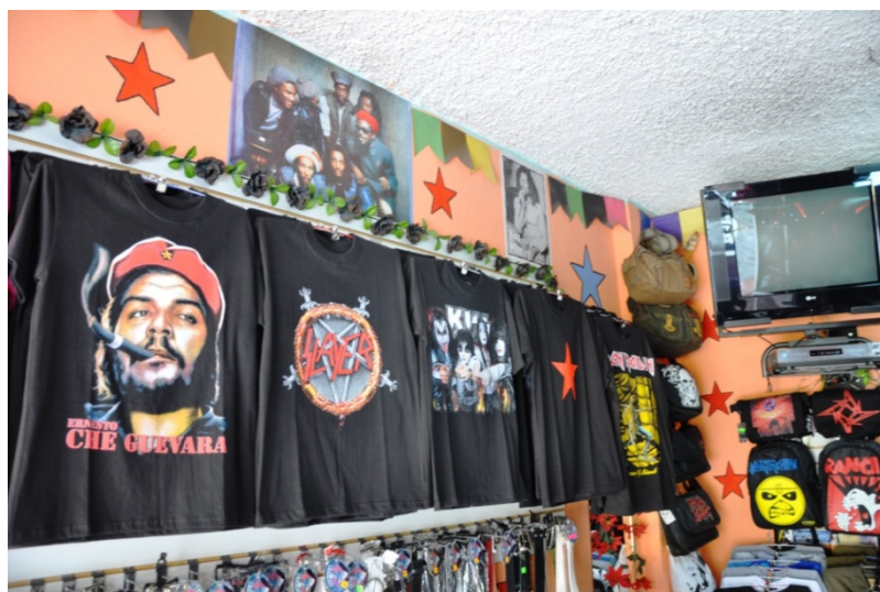
Personajes conocidos como el Che, están en los atuendos de los rockeros.

Según la autora Cinthia Chiriboga el consumir rock marca ciertas particularidades entre sus seguidores asiduos: hay un discurso y formas de vida que en mayor o menor grado suponen ruptura con las convenciones sociales; hay cuestionamiento a ciertos valores que predominan en la sociedad, la conformidad con las normas, el consumismo, vivir a la moda, seguir un patrón de vida: profesión, perseguir el dinero como meta de la vida; hay la admiración a personajes que encarnan valores que para ellos son importantes como cantantes de rock, personajes políticos como el Che Guevara o el Subcomandante Marcos.