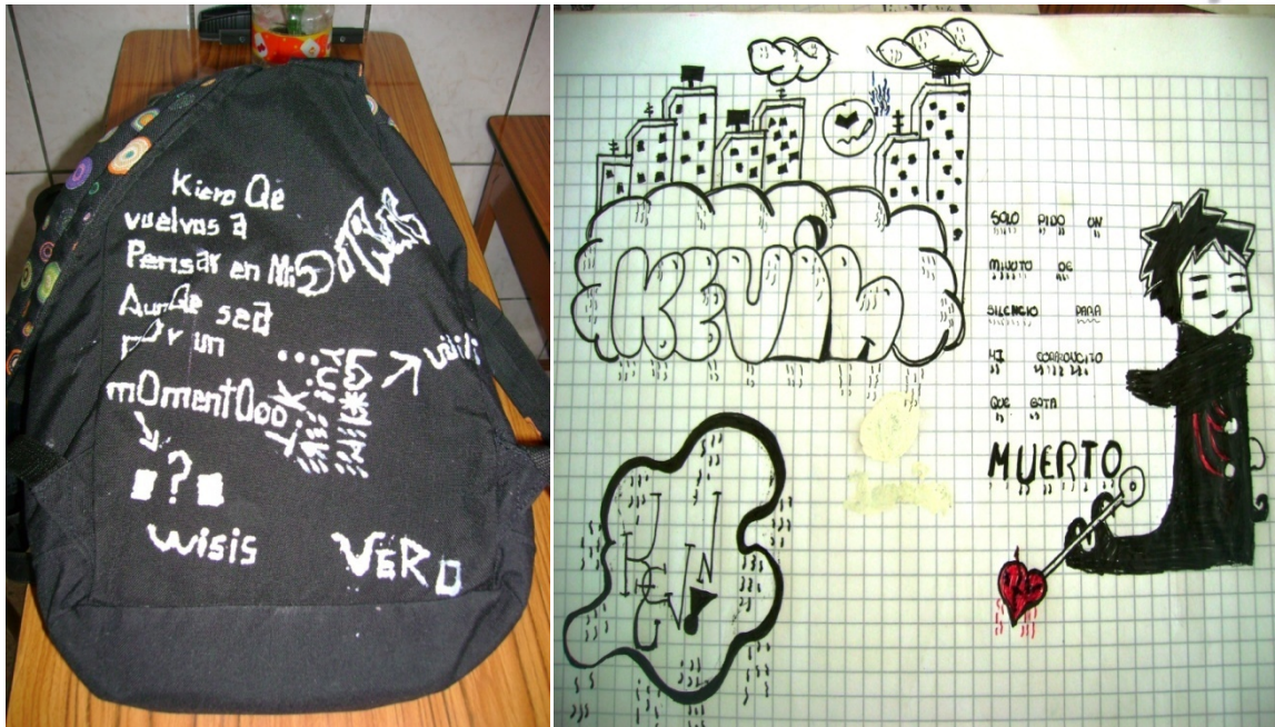
Los graffitis son escritos en los útiles de clases como mochilas y cuadernos.

Es interesante la manera de reunirse o convocarse que tiene este grupo: el celular, especialmente a través de los mensajes SMS, sirve para este fin. Así se convocan en la calle, en la esquina o en el parque. La utilización de estas nuevas redes sociales, principalmente el Hi5, son medios de expresión de sus ideas y sentimientos, y también para realizar invitaciones, por ejemplo para convocar a todos los miembros del grupo a un concierto de rock que se va a realizar en un parque de la ciudad: