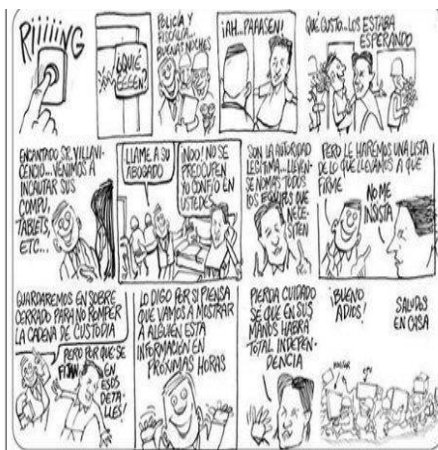
Policía y Fiscalía allanan domicilio de Villavicencio e incautan sus tablets, computadoras, celulares.