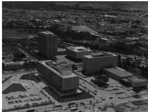
Figura 1: Edificios Centro Cívico primera Fase, Guatemala (1967).

El Centro Cívico de Guatemala, en su primera fase, es un conjunto urbano que está ubicado en el flanco sur de la ciudad el cual albergaría las oficinas de importantes entidades gubernamentales así como la propuesta del “nuevo corazón de ciudad”; asentado en un terreno sin mayores accidentes topográficos ya que esta área se extiende sobre la planicie del “Valle de la Ermita” en donde se asienta actualmente la ciudad capital. A nivel urbano impone otro tipo de traza introduciendo a la ciudad los ejes principales tipo boulevard, los cuales son evidentes en la 6ª avenida la cual sufrió una transformación radical con la demolición de la antigua iglesia del Calvario para poder ser prolongada y la 7ª avenida. Ambas avenidas atraviesan la ciudad de norte a sur. (Fuentes, 2011, 14)