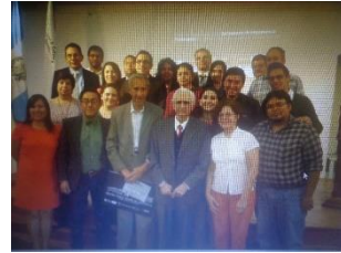
Figura 10: I Taller Participativo Validación del Centro Cívico como Patrimonio Nacional IDAEH, Guatemala (2014).