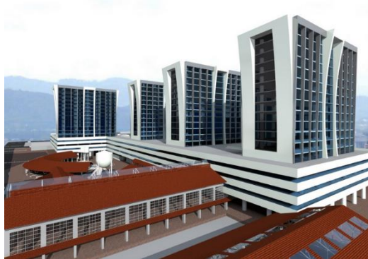
Figura 13: Propuesta Centro Administrativo del Estado CAE, Guatemala (2015)

a duda vendría, no sólo a destruir un patrimonio muy importante para los guatemaltecos, sino a contaminar el Centro Cívico poniendo en peligro su condición de Patrimonio de la Nación y, por ende, la posibilidad que ser elevado a Patrimonio de la Humanidad.