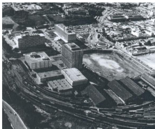
Figura 12: Primera Fase Centro Cívico, Guatemala (1960).

Unos meses después se dio a conocer el interés por intervenir el área en donde actualmente se encuentran las instalaciones de la Estación Central de Ferrocarriles de Guatemala, Patrimonio Industrial protegido por las leyes de Patrimonio de nuestra nación. La misma fue la estación de ferrocarriles más grande de Centro América en su momento y se encuentra ubicada al lado este del Centro Cívico.