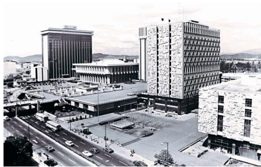
Figura 4: Vista aérea del Centro Cívico, Guatemala (2007).

El Centro cívico, en su primera fase, está formado por cuatro edificios los cuales están relacionados entre sí por medio de plazas y pasarelas que se vuelven esos elementos articuladores que tanto caracterizaron el urbanismo moderno.