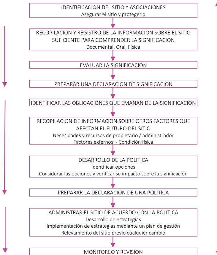
Figura 11: El proceso de la Carta de Burra. Secuencia de investigaciones, decisiones y acciones

Durante el Taller de validación se nombra a un presidente de mesa quién se encargó de recopilar los resultados de la discusión que se generara en cada mesa y se responsabilizaron por enviar de forma digital la información a la comisión. Por otro lado se les exhortó a