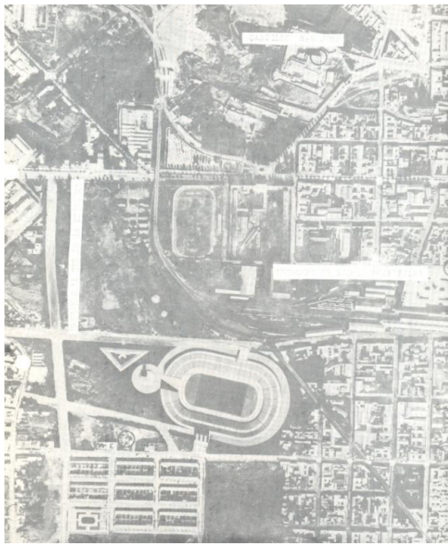
Figura 2: Ciudad Olímpica, Guatemala (1950).

Varios aspectos favorecieron el desarrollo de este conjunto urbano: la migración de habitantes de las áreas rurales a la capital, la importante movilización de los habitantes del centro de la ciudad hacia la zona sur (con el consecuente desarrollo inmobiliario por parte del sector privado), la fuerte inversión estatal al construir la Ciudad Olímpica en 1950 para celebrar los VI Juegos Centroamericanos y del Caribe (lo que revalorizó una extensa área alrededor) y, por último, la intervención municipal al ampliar la Sexta Avenida sur y construir el Palacio Municipal. Todo lo anterior germinó en el terreno fértil de una sociedad ávida de nuevas ideas y de un gobierno deseoso de ser reconocido como generador de progreso y modernidad.