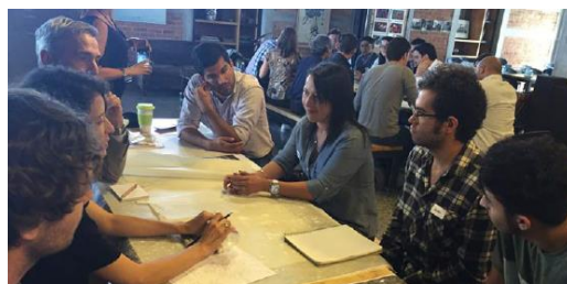
Figura 14: Taller Participativo Mesas de Trabajo en Fundación Crecer, Guatemala (2015)

Como resultado de dicho Taller emana lo que los miembros de la Mesa Técnica denominaron como propuesta de Parque Cultural Industrial-Patrimonio. 3