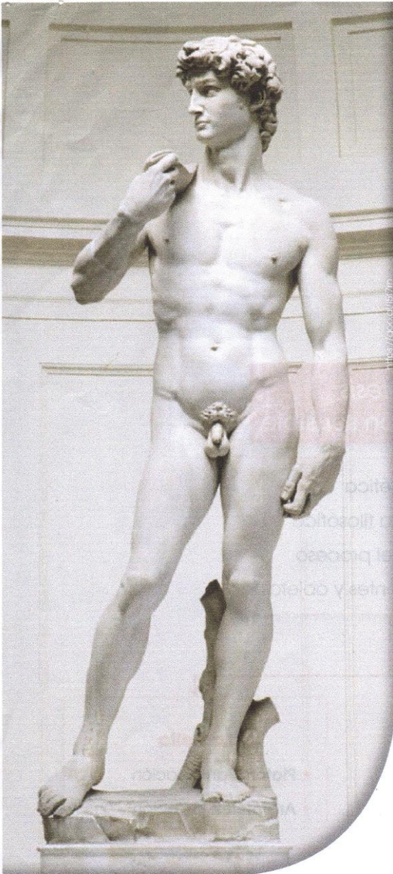
■ David , de Miguel Ángel. Las artes clásica y renacentista reflejan una anatomía humana idealizada en los personajes importantes de la historia.