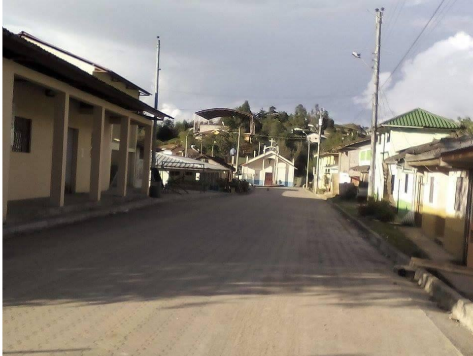
Foto de la comunidad