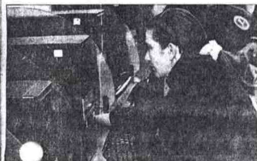
El servicio de internet es importante en la tarea estudiantil.

Las bases digitales a las se tiene acceso son: Spirit Ebsco Research, Proquest, le Cengage Learning, W Interscience, OALster, Di INASP, Flasco; bases de c especializados en salud: S LO, HINARI, PLOS, Biblio Virtual en Salud (BVS); b de datos para consulta de ciencias agropecuarias: I (Instituto Interamericano Cooperación para la Agricultura), SIDALC (Sistema de formación y Documentación Agropecuaria de las Américas) y USDA (Página oficial Departamento de Agrícola de los EEUU).