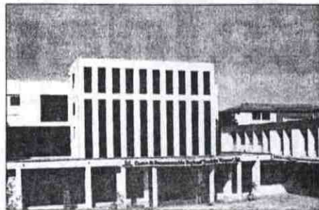
Un aspecto del edificio donde funciona la biblioteca "Juan Bautista Vázquez".

Centro de Documentación "Juan Bautista Vázquez" de la Universidad de Cuenca, cumple 128 años de atención a la región. Se abre una serie de nuevos servicios.