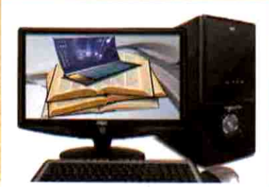
BASES DE DATOS DIGITALES

Permite la búsqueda de información referencial de todo el fondo documental que posee el CDR. El usuario podrá identificar las obras mediante el código y luego ubicarlo en el estante correspondiente.