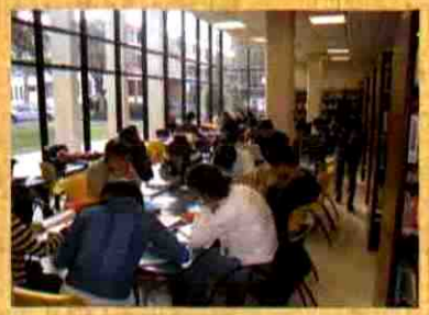
PRÉSTAMO EN SALA DE LECTURA

El CDR facilita a toda la comunidad universitaria el material bibliográfico en préstamo para ser llevado a domicilio; debiendo el usuario, devolverlo en el plazo establecido para cada obra.