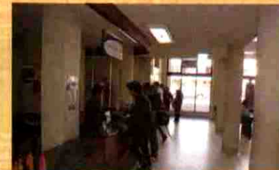
PRÉSTAMO EXTERNO Y DEVOLUCIÓN

Conjunto de información científica, de contenido multidisciplinaria, permite el acceso a e-books y artículos online a texto completo, en 29 bases de datos digitales (por suscripción, convenio o libres).