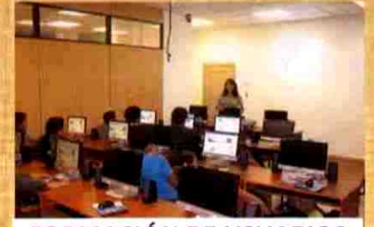
FORMACIÓN DE USUARIOS

El CDRJBV facilita el acceso a Internet, ya sea a través de computadoras o a través de la red inalámbrica.