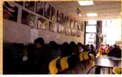
INTERNET EN COMPUTADORAS Y WIFI

Los usuarios acceden a este servicio mediante el pedido al bibliotecario el material bibliográfico de escasa circulación y de los ejemplares repetidos de algunos documentos que están en estantería abierta