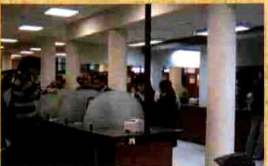
CONSULTA O DE REFERENCIA

El objetivo de este servicio, es brindar asistencia y asesoramiento sobre el uso correcto de los servicios y recursos de la biblioteca a fin de lograr una utilización más eficaz.