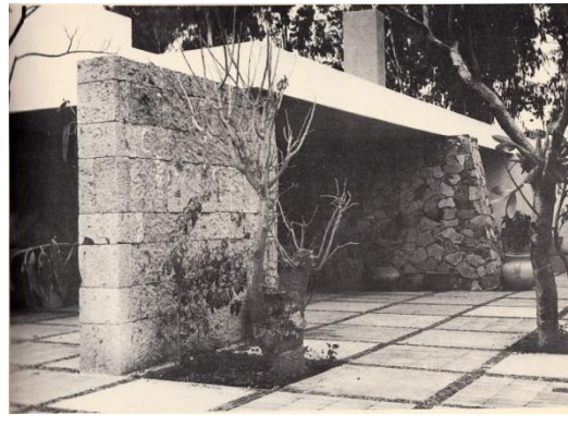
Figura 4: Casa Henonin (1959), Arq. Max Henonin.

diversos materiales es el producto de plantear el proyecto a través de planos horizontales y verticales.