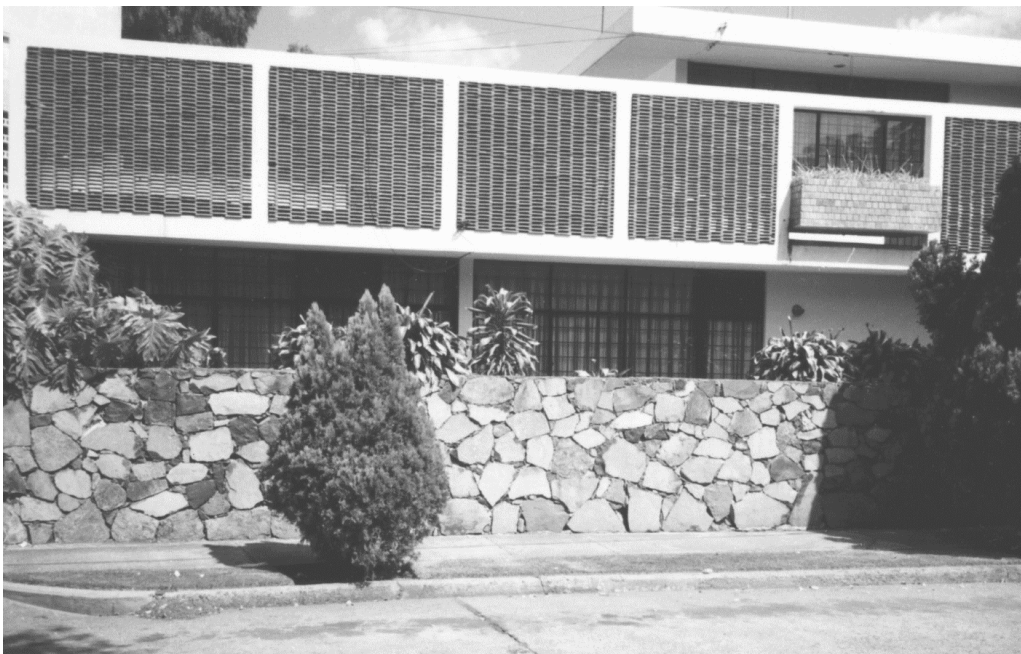
Figura 2: Casa Ortiz Parra (1957), Arq. Enrique Nafarrate.

Cuando el trabajo del artesano y el arquitecto se unían, llegaban a creaciones de piezas de celosía que en sí eran