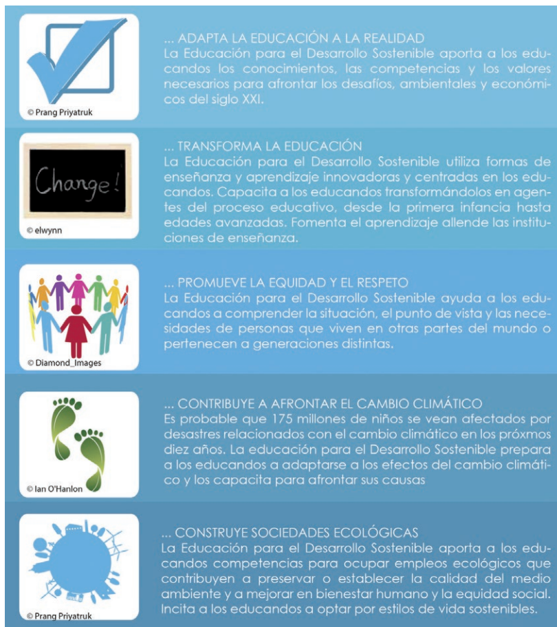
Figura 2. Razones de la educación para el desarrollo sostenible.