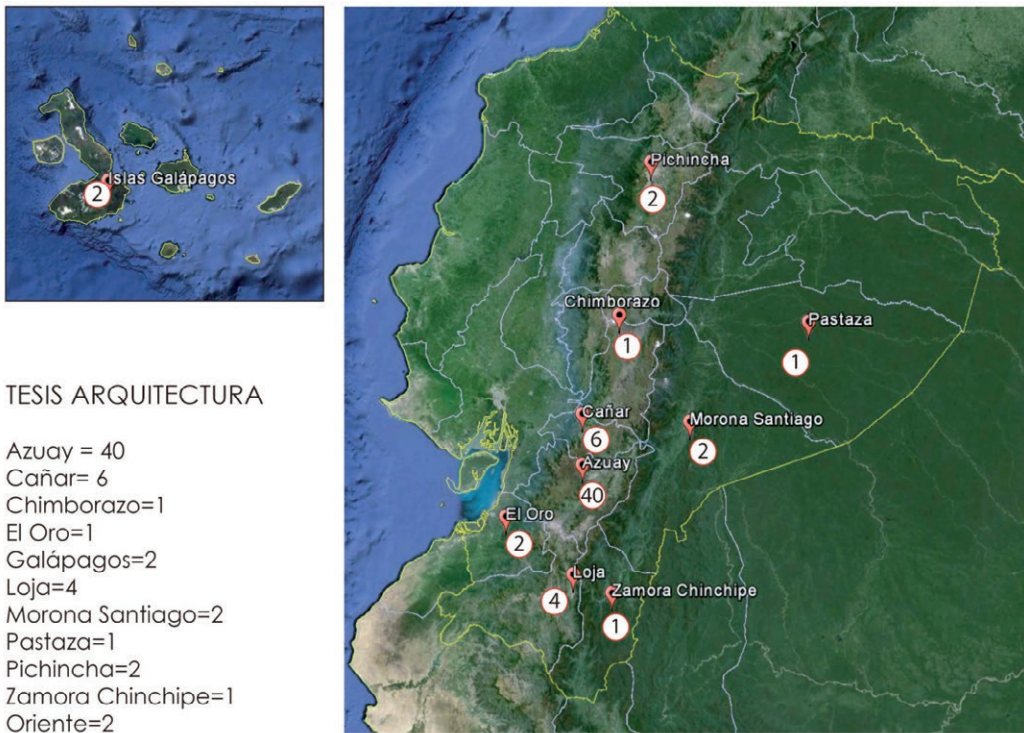
Figura 3. Ubicación del tema de estudio de sostenibilidad en las tesis de pregrado de la facultad de arquitectura y urbanismo de 1968 a 2014.