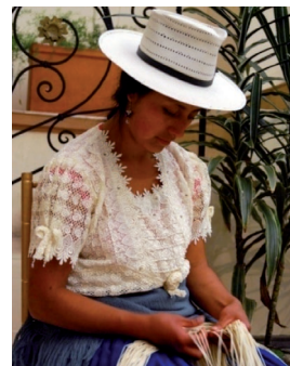
Figura 4: Tejedora de Sombrero de Paja Toquilla.