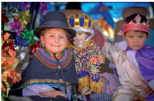
Figura 3: Pase del Niño Viajero.