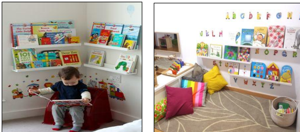
Figura 2. Modelos de implementación de un espacio de lectura (Portal Pinterest, 2017, pág. 1).

En la actualización curricular del 2016, el tema de la lectura tiene gran importancia, por lo que se recomienda la implementación de la biblioteca infantil o espacio pedagógico de lectura donde el estudiante cuente con diversos materiales de lectura entre los que pueden constar libros tradicionales, periódicos, revistas, entre otros elementos que fomenten la lectura en el niño (Ministerio de Educación del Ecuador, 2016, pág. 1).