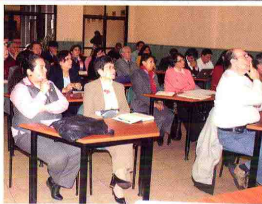
La Dirección de Planificación organiza talleres con el objetivo de definir, de forma preliminar, la visión institucional y las políticas institucionales.