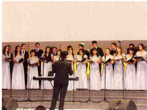
Coro de la Universidad de Cuenca