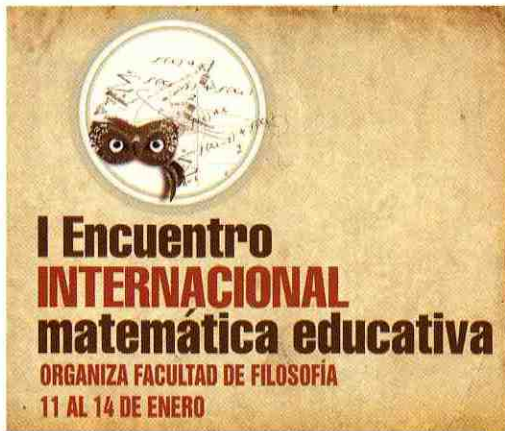
Afiche promocional del evento