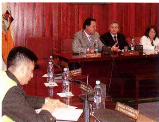
Autoridades universitarias y de la ciudad buscan una solución al problema de inseguridad.