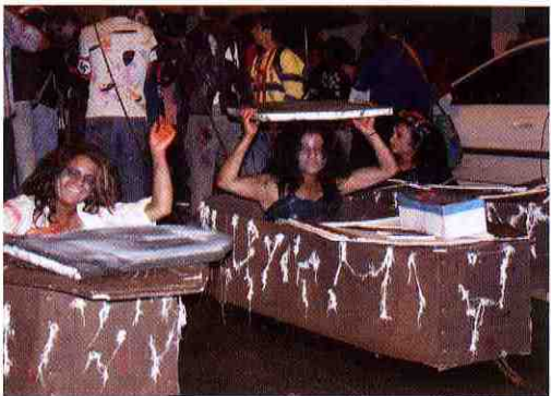
Parte de la comparsa ganadora