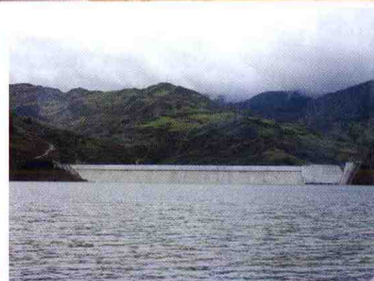
Proyecto Fondo de Compensación Ambiental (FCA) en el área de influencia directa del proyecto hidroeléctrico Mazar y Sopladora.