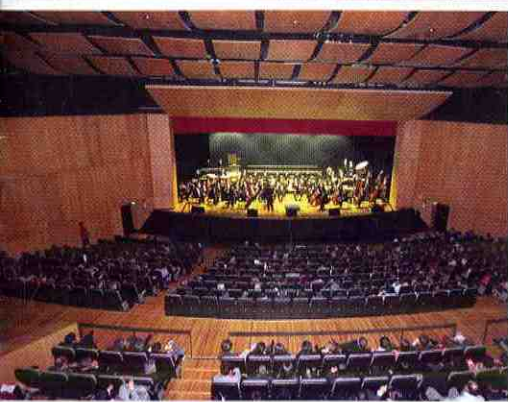
Teatro "Carlos Cueva Tamariz" inauguró nueva edificación.