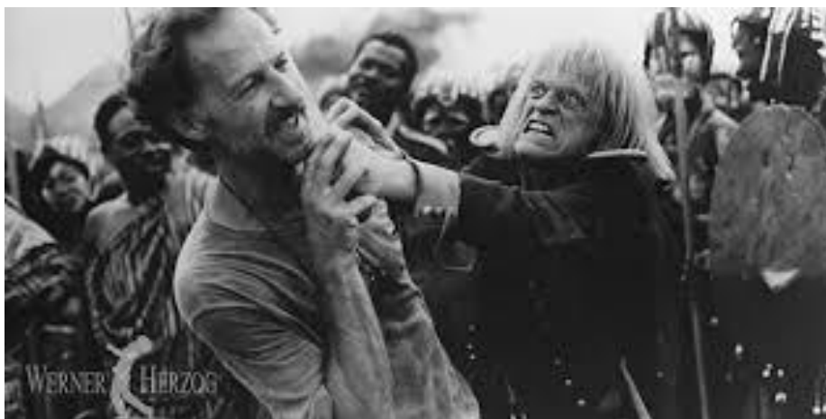
Fotografía 1. Fotograma de la película “Bandido cobra verde” (Herzog 1987)

Se prefirió siempre mantener una visión occidental, que conceptualice desde su punto de vista las razones de ser y estar en el mundo. Las diferentes narrativas europeas actuaron con resistencia a lo que prefirieron verlo siempre como lo extranjero, indomable, impenetrable, existente solo desde la perspectiva fantástica y alegórica consolidando la óptica e idea de la superioridad europea. Esto consolidaba el espíritu burgués reinante, el cual se encontraba tedioso y vacío, ávido de “lo otro”, necesitado de cómoda recreación.