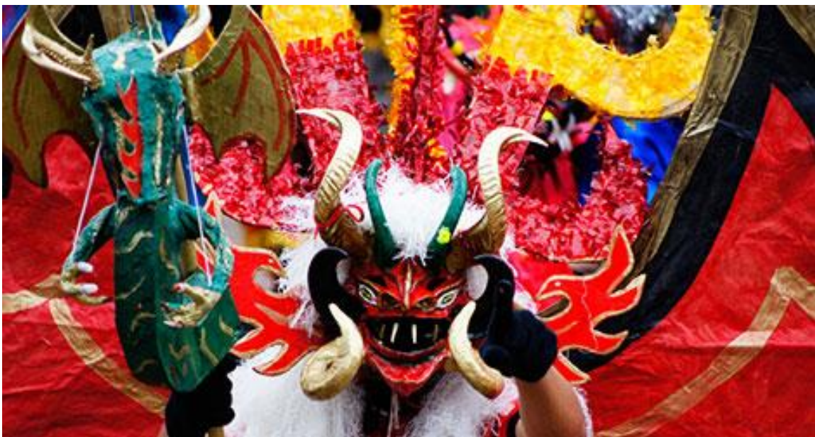
Fotografía 5: Fiestas Ecuador.

el barroco europeo . Ha esto, se sumó la pasión existente en la forma de ser indígena, no comprendida por la visión eurocentrista, que consideraba a los indios como brutales e instintivos. Este carácter de abundancia y exageración, se expresa de una manera bastante elocuente a través de las expresiones de las fiestas, pues es ahí donde se exteriorizaba y manifestaba en conjunto la sociedad: “En el discurso contemporáneo sobre el barroco, la fiesta ha ocupado un lugar privilegiado: Escenario de todas las mezclas -lo sagrado y lo profano, lo público y lo privado, lo aristocrático y lo popular, lo blanco y lo indio”, (Moreano, 2016 p.64) es decir, lo festivo se devino en incluyente y permitía en el mismo escenario a las élites religiosas y civiles, se presentaban juntos los artistas indios y mestizos, superando incluso la grandeza de las expresiones religiosas de los imperios aztecas e incas.