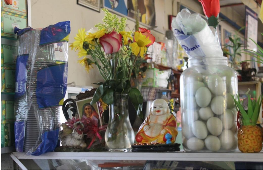
Fotografía 3: De todo un poco. Autor Pedro Andrade

En el mundo contemporáneo, ha sido el mismo arte el que ha protagonizado el proceso de desmitificación religiosa latinoamericana. Lo banal y efímero, ya no permiten una convicción religiosa profunda venida desde la ciudadanía. Todo lo contrario, tanto las vírgenes cristianas con sus íconos celestiales como las deidades precolombinas, fueron violadas por los habitantes de los barrios urbanos y suburbanos, que se avocan por una independencia histórica cultural, frente a lo que venga impuesto por la religión como por la no religión. Se producen más bien obras abyectas e iconoclastas en extremo que van llevando a una estética visual distante del ritual y la tradición católica. Esta estética llega, con la fuerza de la comunicación del siglo XXI, con los muy intensos procesos migratorios, con el uso raudo e insospechado -hasta hace pocas décadas- de la web y las oportunidades activas y pasivas que ésta presenta, haciendo cada vez más fácil el uso y el acceso a información sobre la cultura, las artes, las imágenes. El crecimiento de la ciencia y el arte –afirma Néstor García Canclini- permitieron ampliar las fuerzas naturales en pro de una mejor comprensión del mundo, solo cuando se liberaron de la tutela