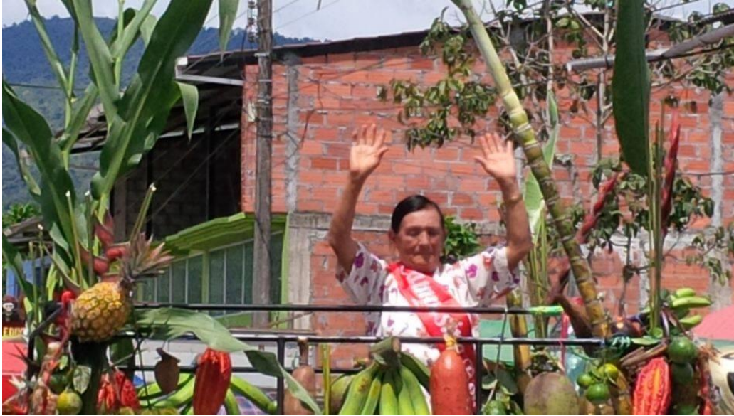
Fotografía 2 : Desfile de pueblo.

Las posibilidades del proceso sincrético vivido, presentan perspectivas que enriquecen, unifican, potencian y armonizan las tradiciones y pensamientos sobre la cultura, la religión, el arte y en general las formas de vida. Se ha pasado entonces, de una óptica e intención revolucionaria de transformación social, hacia una reflexión y apropiación de lo mestizo con una actitud que privilegia directamente al hombre mismo. Esta apropiación, permite proporcionar a nuestros mitos, símbolos y códigos un sentido bastante rico, polisémico, extraordinario, y ahí sí, investido de autenticidad.