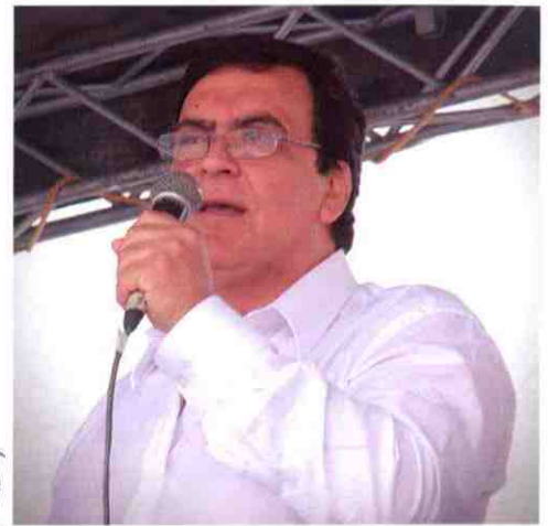
denuncia 1:00 10-Feb-2017

Con la presencia de cerca de 12.000 ciudadanos de amplios sectores sobre todo educativos de los niveles primario, secundario y universitarios además de distintos gremios y la ciudadanía en general, se realizó la denominada "Marcha Blanca" convocada por la Universidad de Cuenca para protestar por el alarmante estado de inseguridad que se vive en la ciudad, la marcha arrancó desde la abarrotada Av. 12 de Abril frente a la ciudadela universitaria con dirección a la plaza cívica, junto al mercado 9 de Octubre, sitio de su culminación, en el trayecto se sumaron otras autoridades de la ciudad, durante el recorrido gracias a la colaboración de la Facultad de Artes se contó con un grupo de estudiantes que brindaron humor y alegría a la ciudadanía que miraba el paso de manifestación. Los estudiantes habían preparado diferentes números dinámicos propiciando, un ambiente para exigir seguridad con una sonrisa y con alegría. En el escenario que recibió a los que marchaban, el Rector de la Universidad en su mensaje, exigió la declaratoria de estado de Alerta para la ciudad por parte del Consejo Cantonal compromiso que asumió el Vice Alcalde. Así con cantos y danzas culminó un evento importante para la ciudad en general y la Universidad de Cuenca demostró una vez más que su liderazgo y el de sus autoridades en temas de tan importantes como este y que atañen toda la ciudadanía.