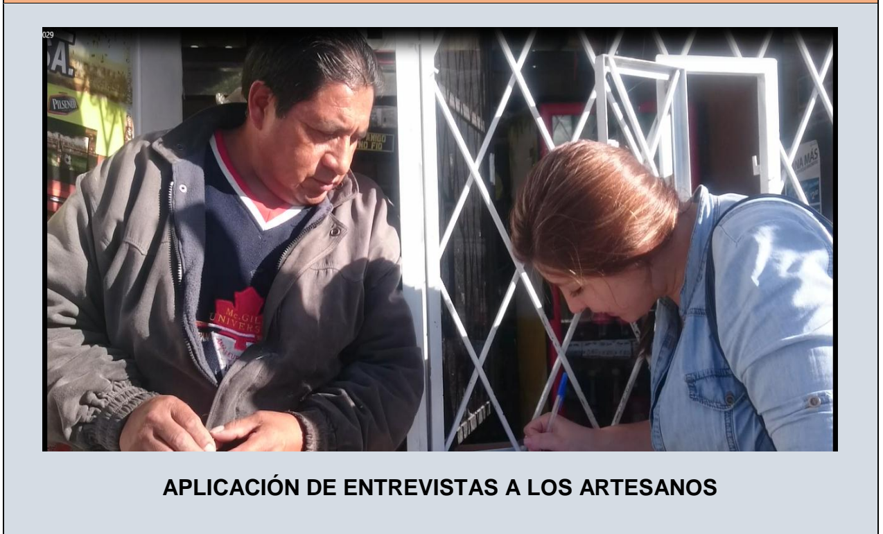
APLICACIÓN DE ENTREVISTAS A LOS ARTESANOS