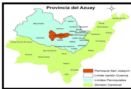
Ilustración 1: Mapa de ubicación de la parroquia San Joaquín

La parroquia San Joaquín se encuentra ubicado en la parte Norte del cantón Cuenca perteneciente a la Provincia de Azuay. San Joaquín es una parroquia rural de la Ciudad de Cuenca, está ubicada a 7 kilómetros al noroeste de la ciudad de Cuenca, limitada al Norte con la Parroquia Sayausí (río Tomebamba), al Sur con la Parroquia Baños (río Yanuncay); al Oeste la Parroquia de Chaucha y Molleturo y al Este con la Ciudad de Cuenca. Está conectada por dos vías asfaltadas desde la ciudad de Cuenca que conducen a su centro parroquial, la denominada Autopista Medio Ejido y la Av. Ordoñez Laso.