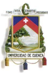
TABLA DE ILUSTRACIONES