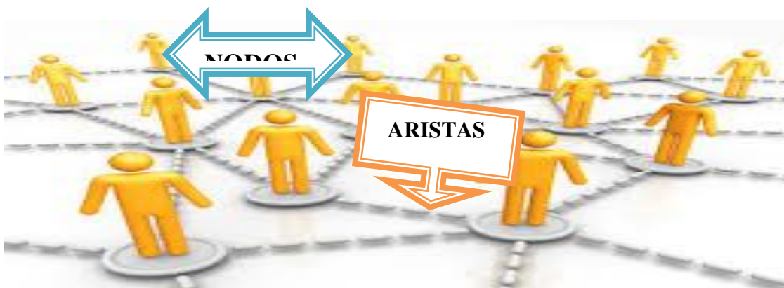
Ilustración 1: Partes de una red social

Una red social se define como una estructura social compuesta por un conjunto de individuos que se relacionan entre sí, a los individuos se los conoce con el nombre de nodos y a las relaciones entre los nodos se las conoce como aristas (Requena, 2003, pág. 5:9).