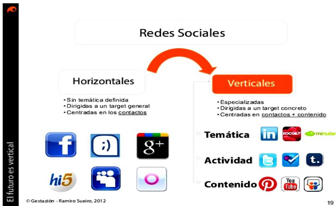
Ilustración 2: Tipos de redes sociales