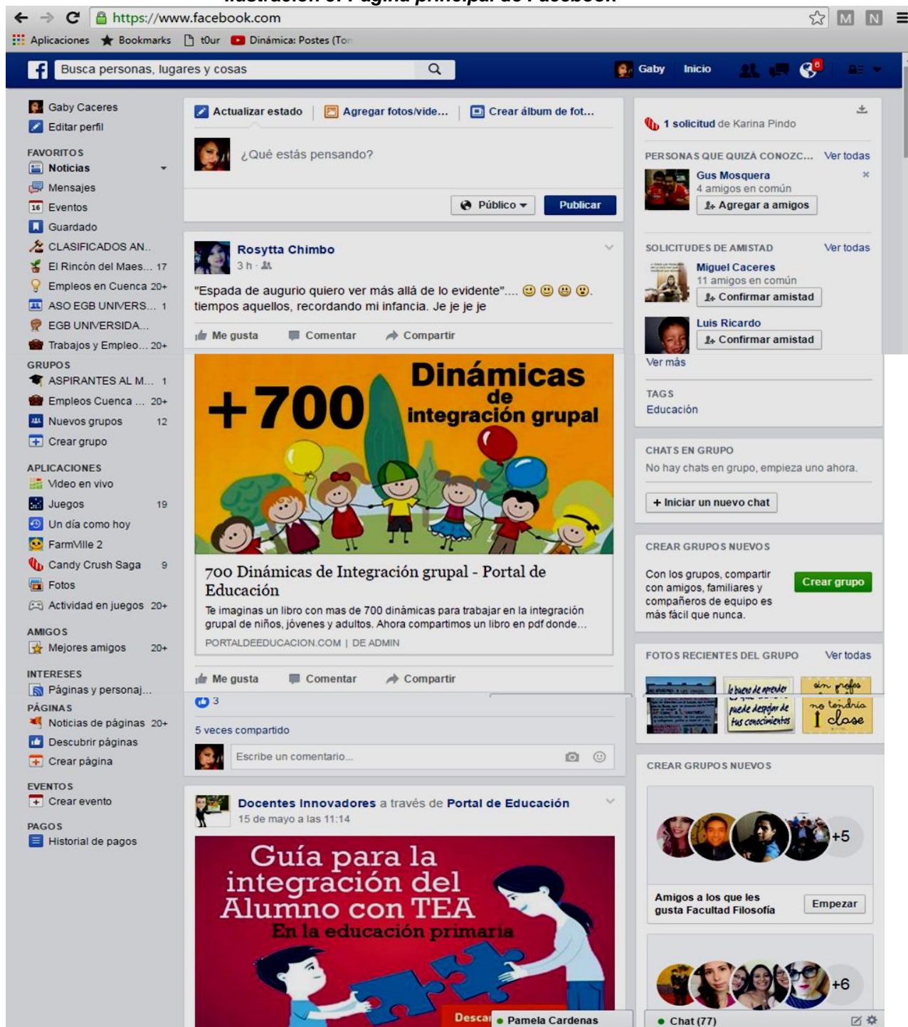
Ilustración 3: Página principal de Facebook

encontrar información pública de los demás usuarios, los cuales están agregados dentro de un grupo de amistad (Facebook, 2016).