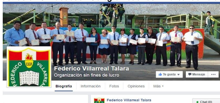
Ilustración 5: Facebook Colegio Federico Villareal de Talara.