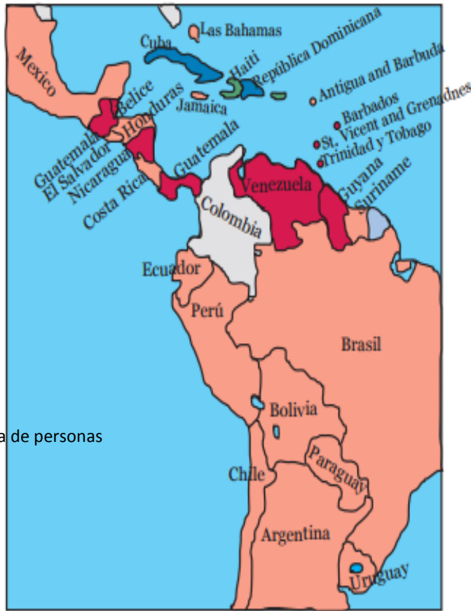
Tabla 1: Casos trata de personas