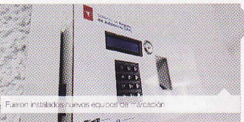
Fueron instalados nuevos equipos de marcación.

En el mes de diciembre iniciará la maestría en "Conservación y gestión del patrimonio cultural edificado", que se encuentra en período de inscripciones hasta el 18 de octubre y de matrículas hasta el 15 de noviembre. La Facultad de Ciencias de la Hospitalidad, está preparando el inicio de la maestría en Turismo rural y comunitario, que ya fue aprobado por el CES.