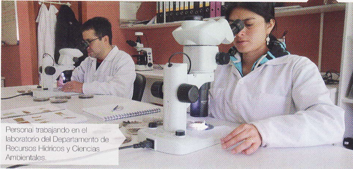
Personal trabajando en el laboratorio del Departamento de Recursos Hídricos y Ciencias Ambientales.

Con la finalidad de seguir fortaleciendo la investigación y capacitación del personal académico de la Universidad de Cuenca, el H. Consejo Universitario el 16 de julio del presente año creó el Departamento de Recursos Hídricos y Ciencias Ambientales. Entre los aspectos considerados para la creación de este departamento están el impulsar la investigación científica y la gestión del primer doctorado.