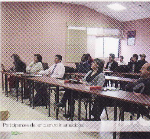
Participantes del encuentro internacional.

Se calcula que este proceso tomará 180 días, período en el que se desarrollará 96 talleres de capacitación, con la participación de las principales autoridades universitarias, decanos, subdecanos, y jefes departamentales.