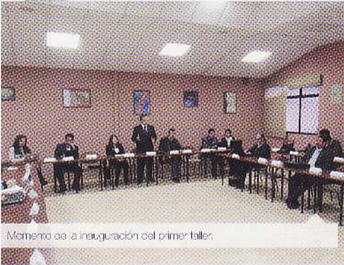
Momento de la inauguración del primer taller.