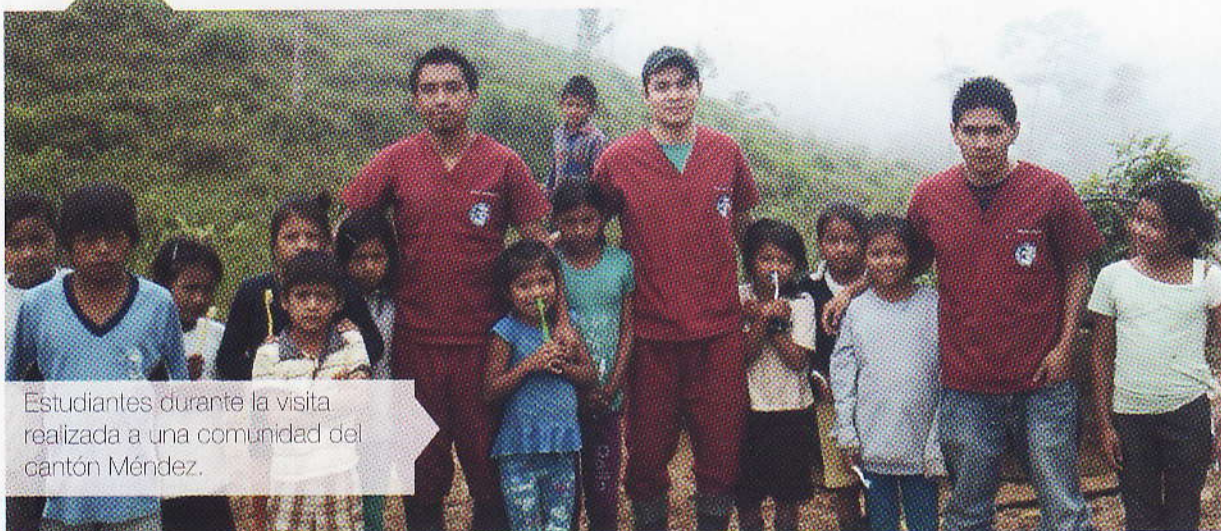
Estudiantes durante la visita realizada a una comunidad del cantón Méndez.

Múltiples actividades de colaboración con diversas instituciones y organizaciones comunitarias de la región vienen cumpliendo los docentes y estudiantes de la Facultad de Odontología a través de las actividades de vinculación con la colectividad.