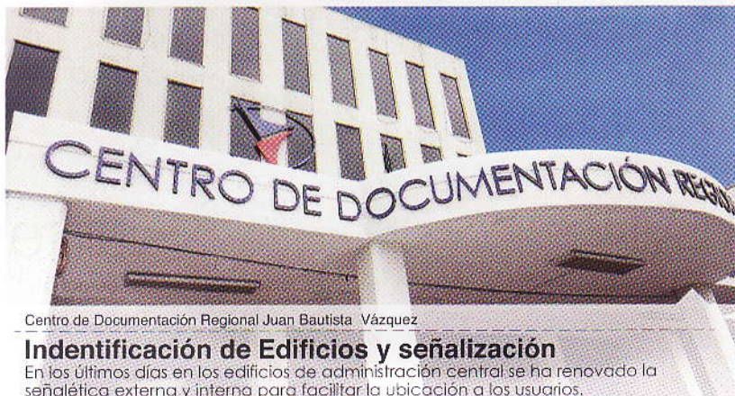
Centro de Documentación Regional Juan Bautista Vázquez