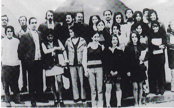
Alumnos de la naciente Especialidad de Periodismo