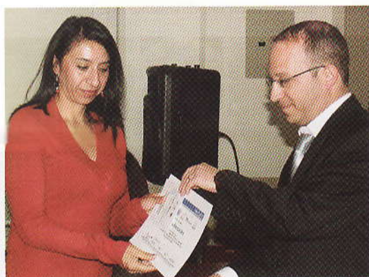
El consul de Israel, entrega el certificado a una participante de taller

Esta cita internacional fue organizada por el Instituto Inter-Universitario de Desarrollo Social y Paz (IUDESP) de la Universidad de Alicante, España, y el Programa Interdisciplinario de Población y Desarrollo Local Sustentable (PYDLOS) de la Universidad de Cuenca, Ecuador, en coordinación con FLACSO - Ecuador, la Universidad Central de Venezuela y el apoyo del Programa de Cooperación Interuniversitaria e Investigación Científica AECID 2010.