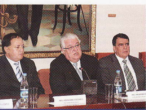
Escuela de la Función Judicial tendrá su sede en Cuenca