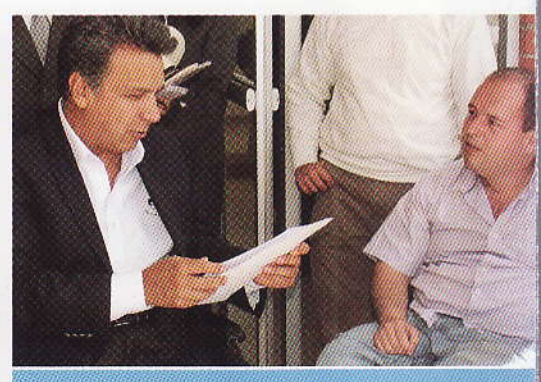
El Feria Lúdica Inclusiva "Juguemos sin barreras" con la presencia del Vicepresidente de la República PAG.5