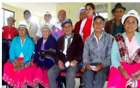
FOTOGRAFÍA. Taller sobre derechos de los adultos mayores