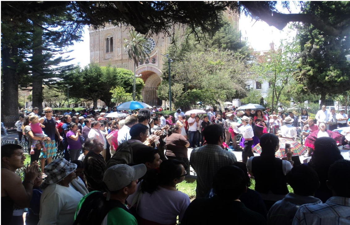
Vista panorámica del público, que disfruto del evento