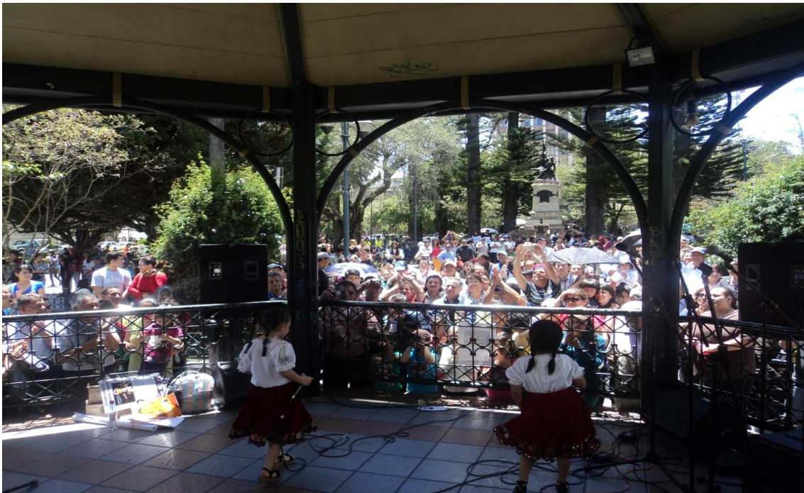
Público presente ovacionando al dúo “Andinito”