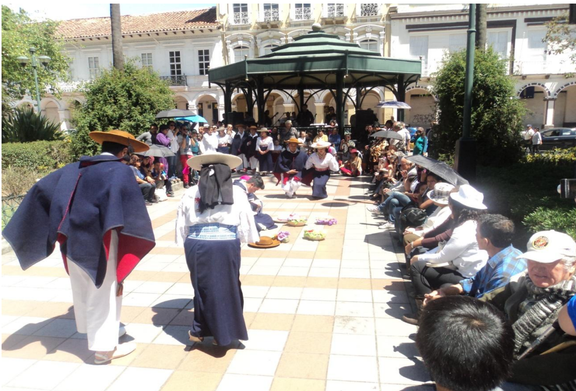
Cuadro: Cotidianidad “Velorio del guagua”, Saraguro. Grupo de danza Kaypimikanchik