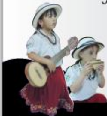
* Dúo Andinito