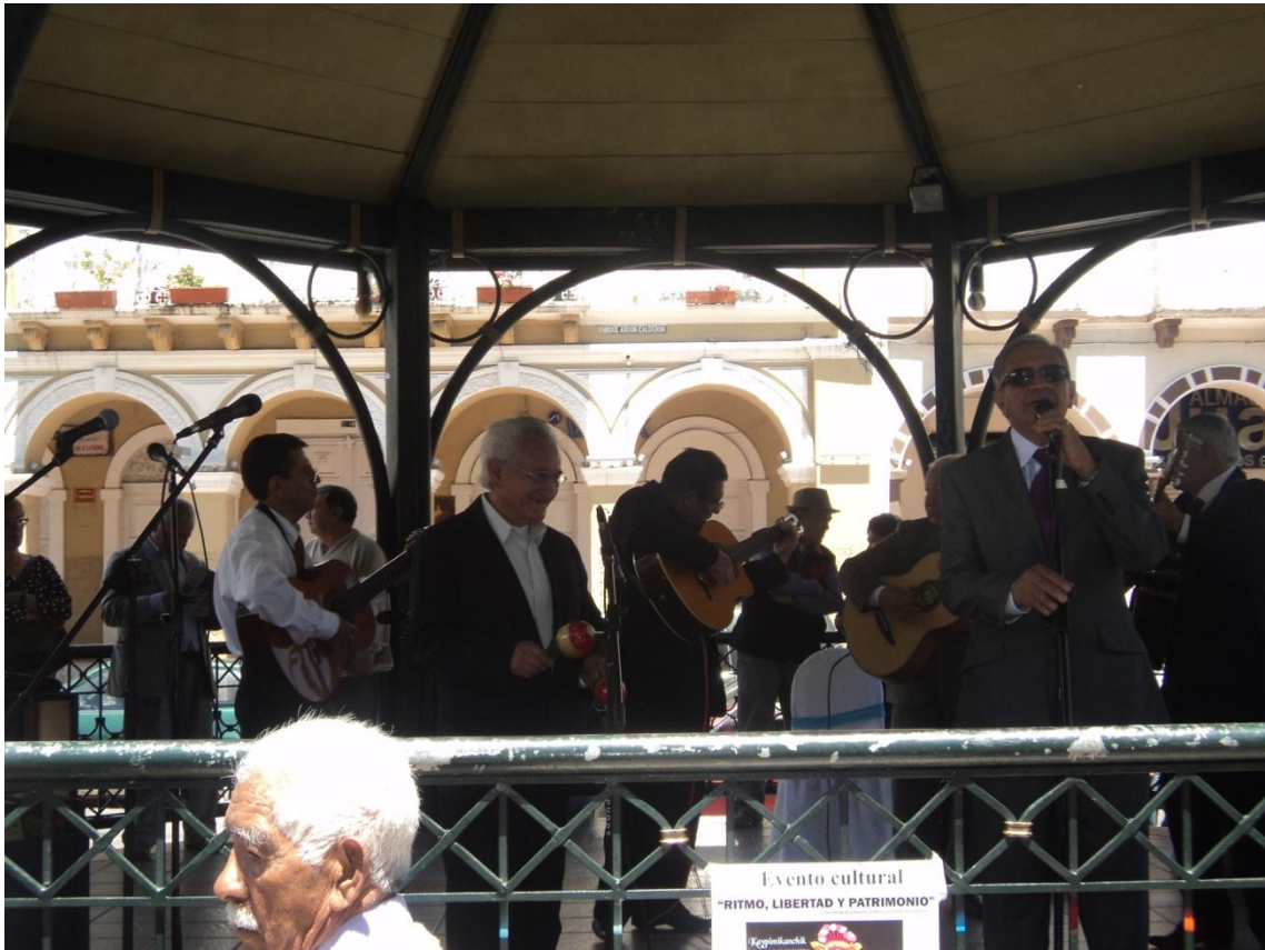
Conjunto de jubilados del IESS.