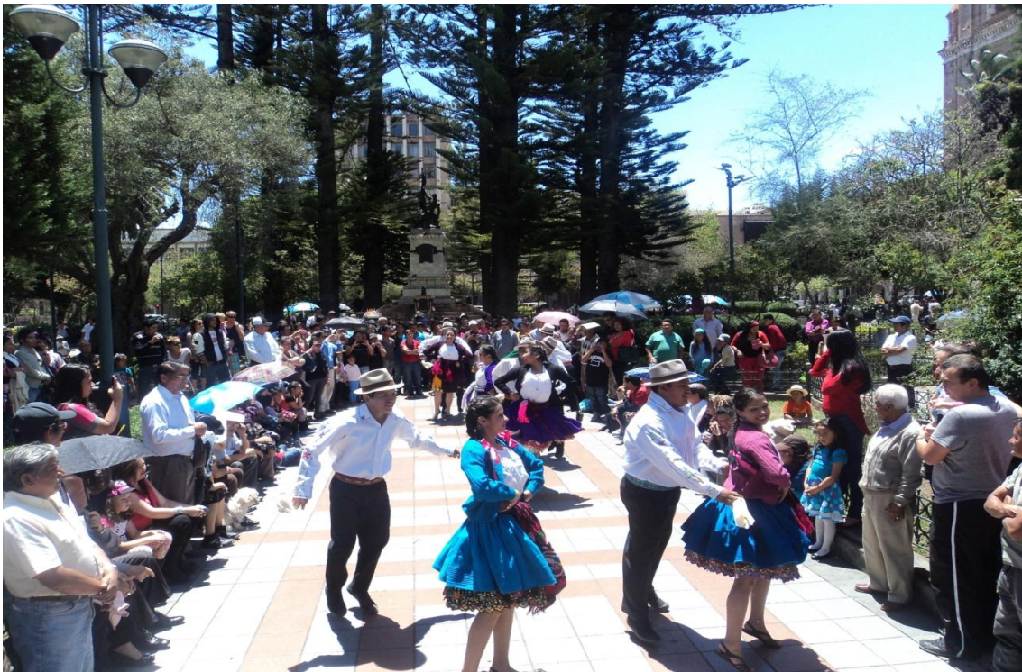
Baile tradicional de “La Chola Cuencana”, grupo Kaypimikanchik.