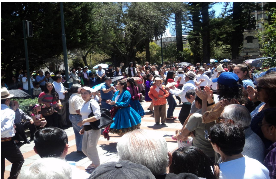
Espectadores, muy contentos compartiendo el baile de la “Chola cuencana”