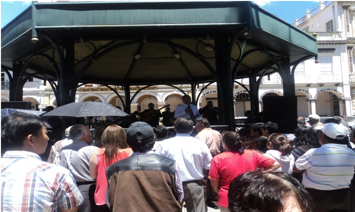
Público presente, admirando la interpretación de un Jubilado, acompañado del conjunto musical