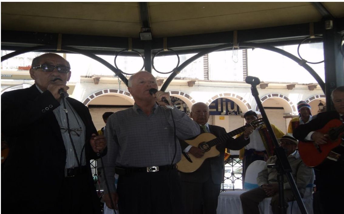
Dúo de Jubilados