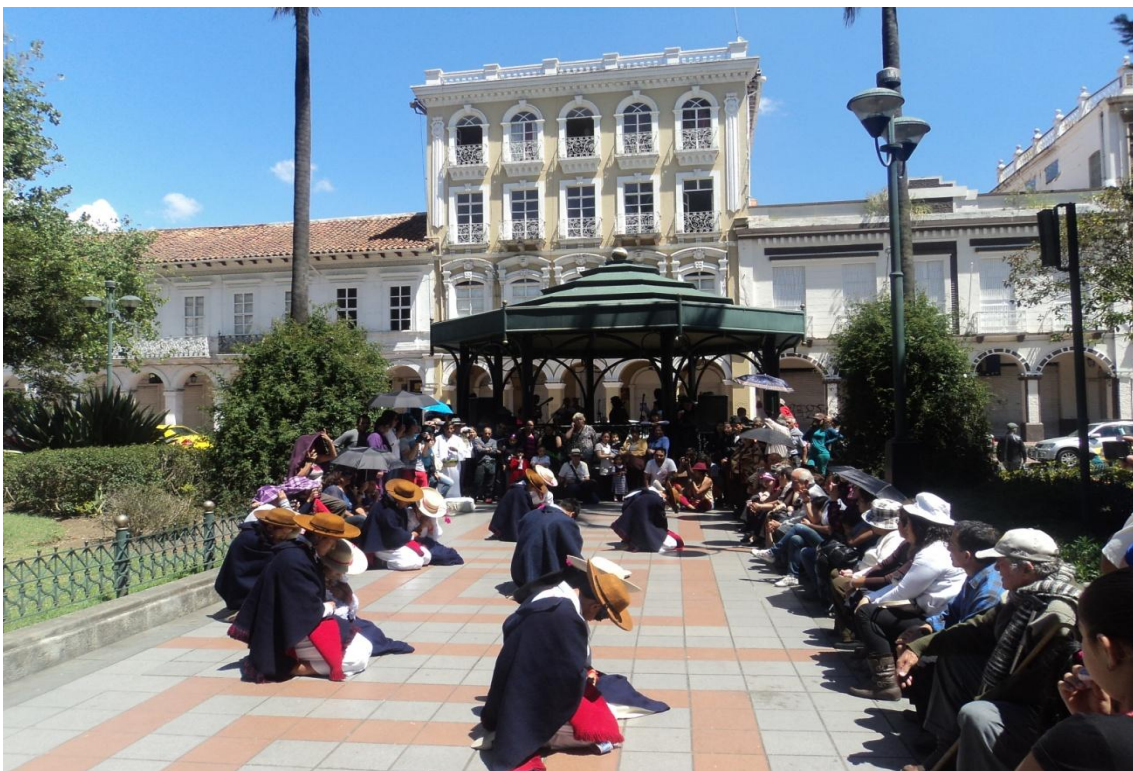
Cuadro: Cotidianidad “Velorio del guagua”, Saraguro. Grupo de danza Kaypimikanchik,