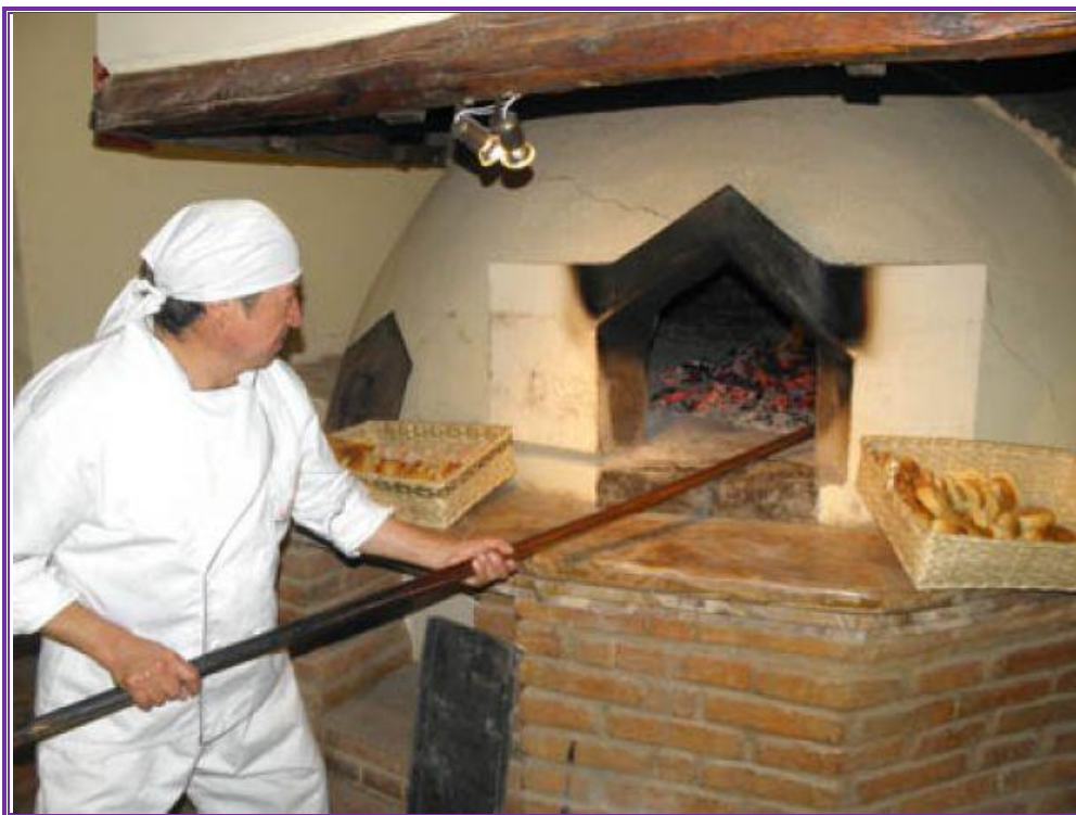
Horno tradicional de leña.