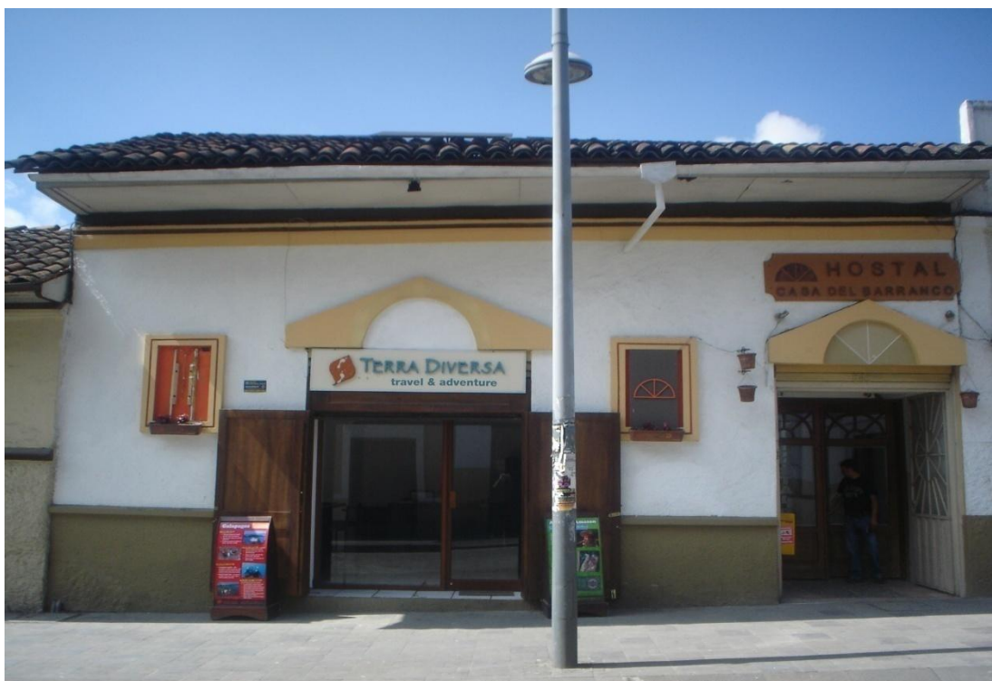
Detalle de la arquitectura popular del sector. Foto tomada el 10/11/2011.