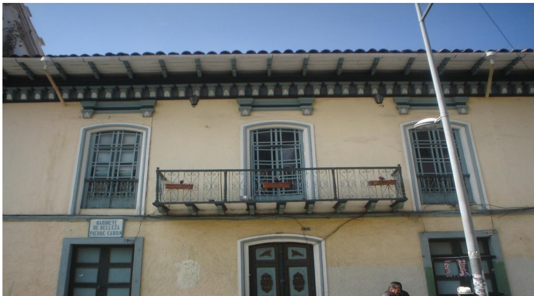
Detalle de la arquitectura del sector. Foto tomada el 10/11/2011.