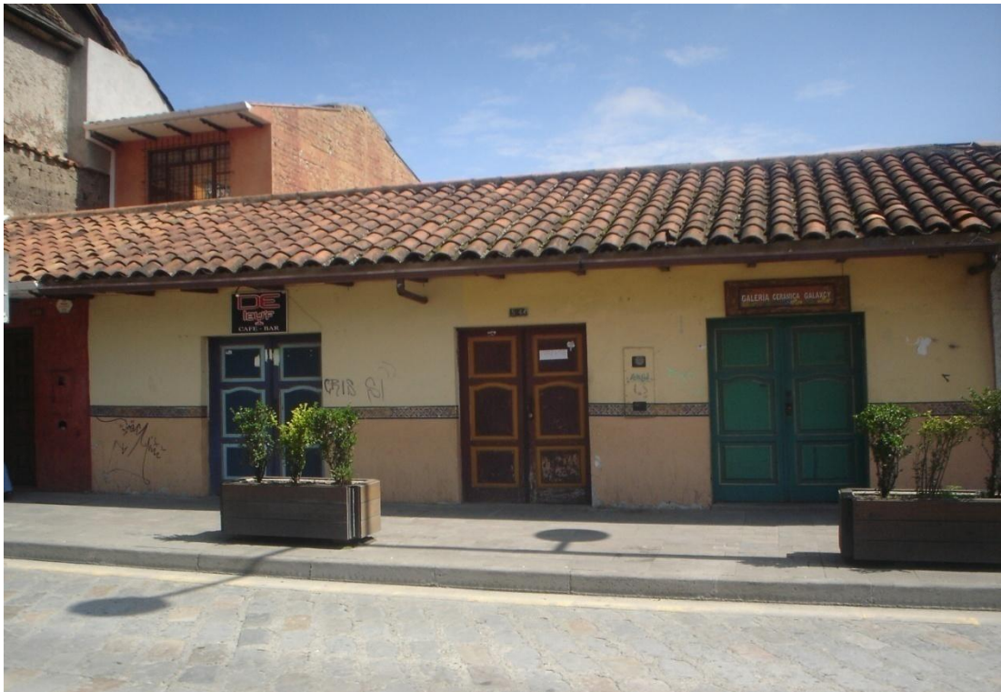
Detalle de la arquitectura popular del sector. Foto tomada el 10/11/2011.