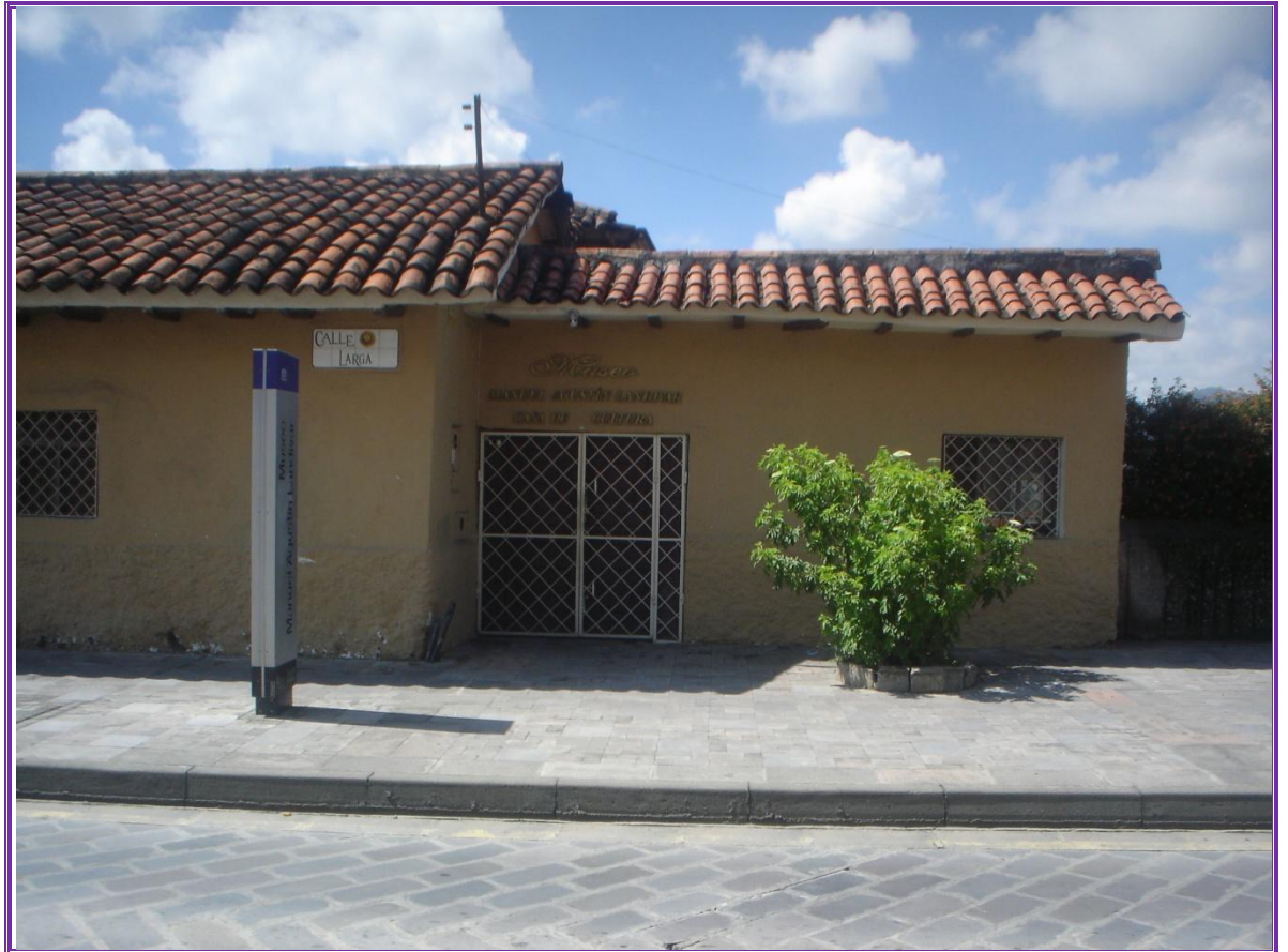
Museo Manuel Agustín Landívar. Detalle de la arquitectura popular del sector. Foto tomada el 10/11/2011.