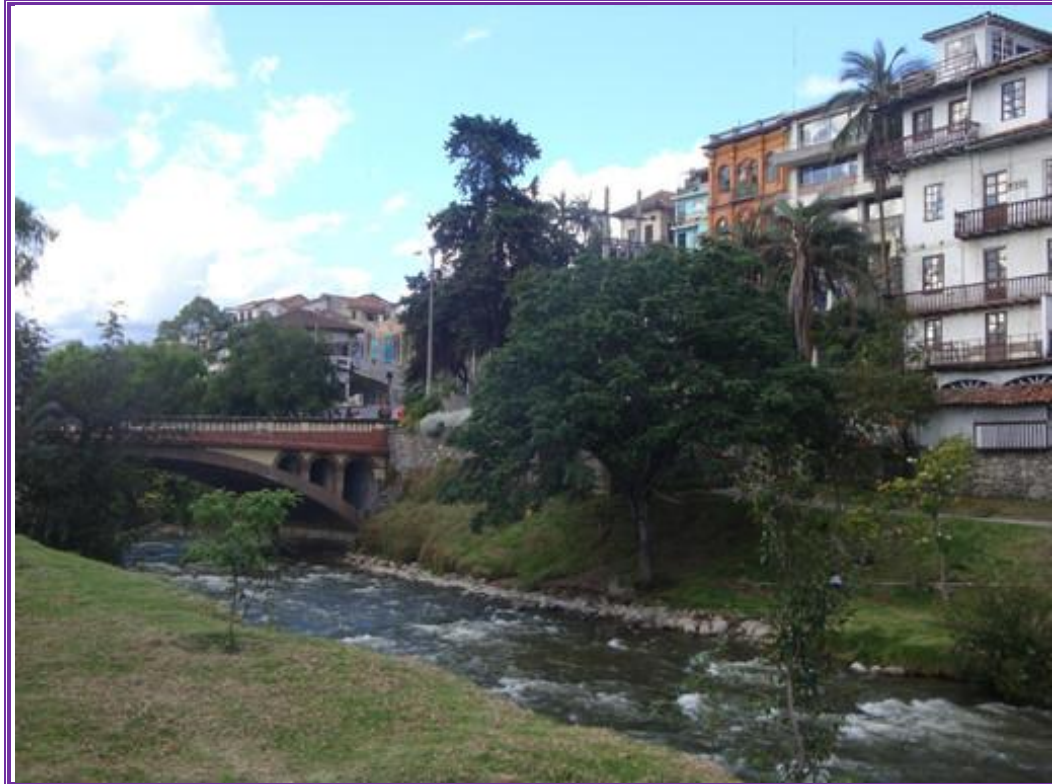
Vista del Puente del Centenario. Detalle del río Tomebamba. Foto tomada el 10/11/2011.