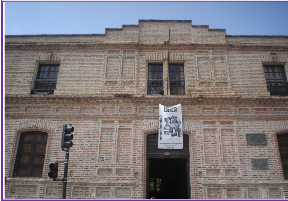
Museo Remigio Crespo. Detalle de la arquitectura del sector. Foto tomada el 10/11/2011.