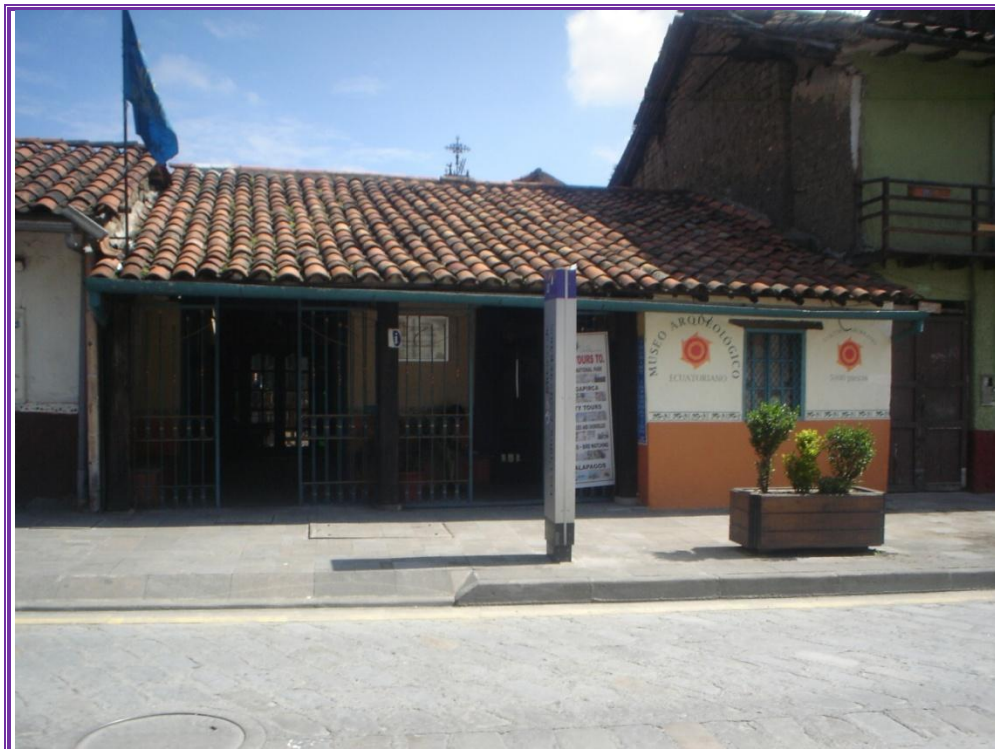
Museo de las Culturas Aborígenas. Detalle de la arquitectura popular del sector. Foto tomada el 10/11/2011.