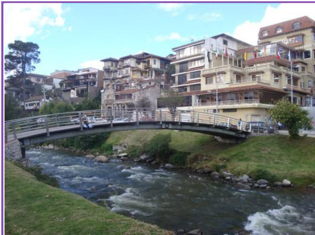
Vista del puente peatonal Juana de Oro. Detalle de la arquitectura del sector. Foto tomada el 10/11/2011.