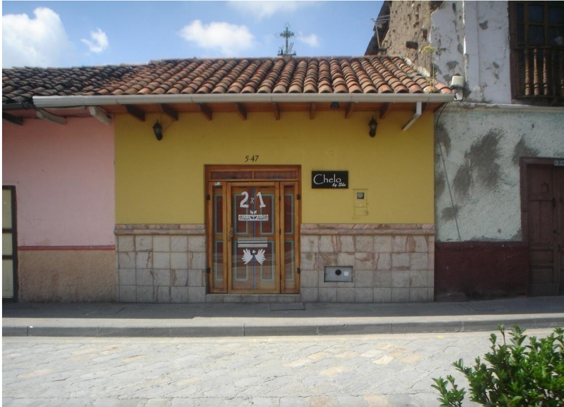
Detalle de la arquitectura popular del sector. Foto tomada el 10/11/2011.