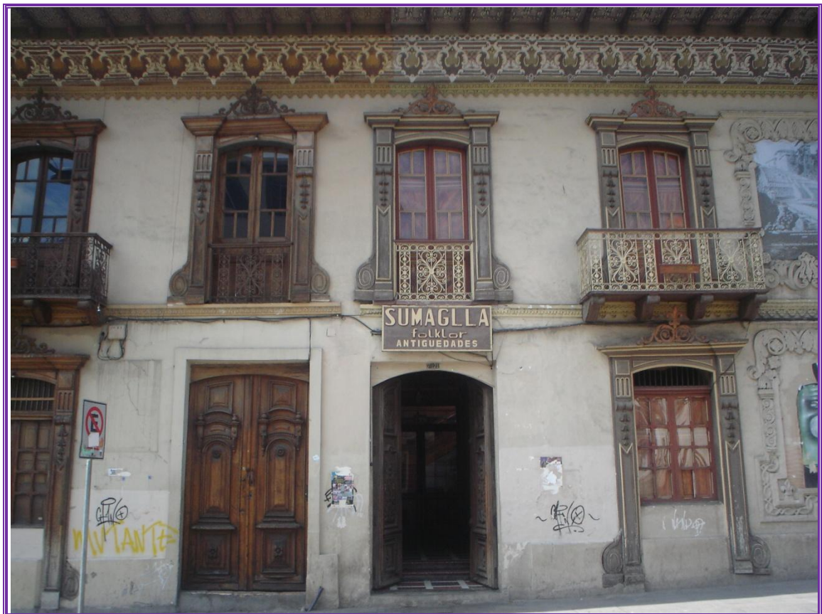
Casa Sumaglla. Detalle de la arquitectura del sector. Foto tomada el 10/11/2011.

La subdivisión de la casa principal en habitaciones más pequeñas debe haber sido una característica colonial original. La mayoría de las alteraciones son republicanas o modernas. La gran habitación única de los constructores del siglo XVIII se volvió insuficiente en un mundo moderno, donde los espacios especializados y la gran cantidad de habitaciones se volvieron necesarios, pues los intereses por la privacidad se volvieron generales.