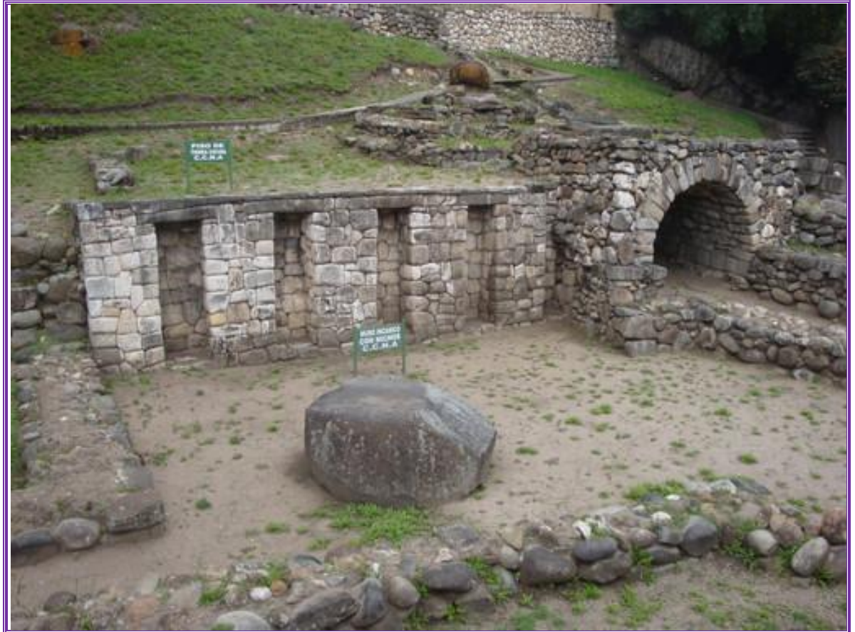
Ruinas de Todos Santos. Foto tomada el 10/11/2011.