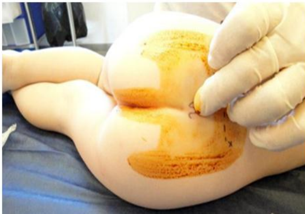
Figura 1. Posición de Sims