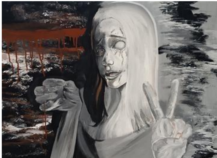
Figura 5: Brito Daniel (2024). Espejismos. (Contraparte 2). Acrílico sobre lienzo.