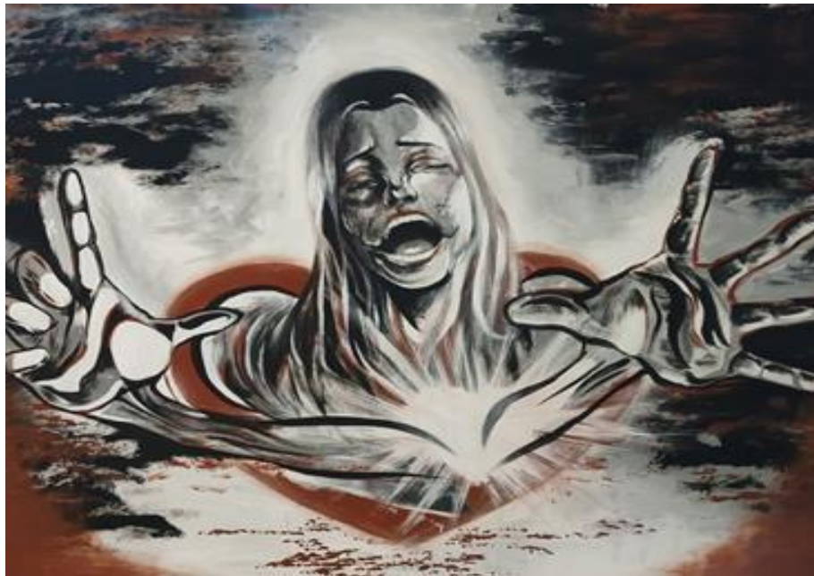
Figura 7: Brito Daniel (2024). Espejismos . (Espejo).