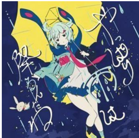
FIGURA 2. TUYU [REI]. (2020, 26 diciembre). Loser girl [Video]. YouTube. Recuperado 3 de febrero del 2024, de https://www.youtube.com/watch?v=7odqG_R4sBs